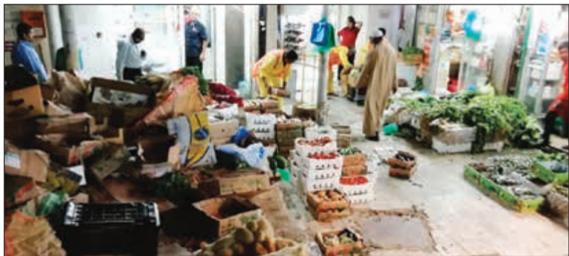
جانب من المواد الغذائية المصادرة خلال الحملة