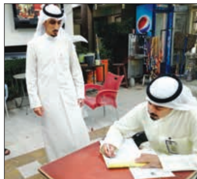
تحرير إحدى المخالفات