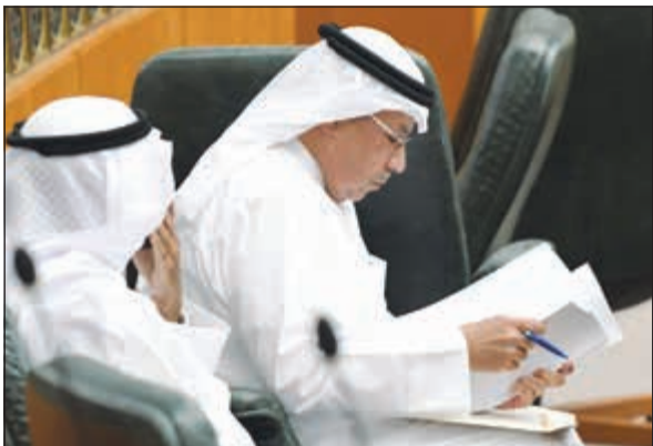
الشيخ خالد الجراح