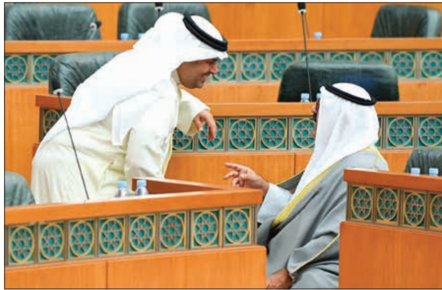
الشيخ ناصر صباح الأحمد ومبارك الحجرف

إيجابية حكما ومجلس الأمة من الجليل أن يراقب ويسلط الضوء على مثل هذه القضايا. وقد اطاعت على تقرير المسجل العقاري في الكويت ووجدت أن هناك عقارات تسجل بأسعار خيالية في منطقة الهبولة، وهذا أمر خطير لأننا نخشى أن تتحول الكويت إلى مركز لغسيل الأموال.