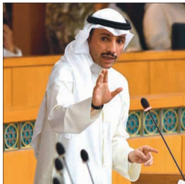
مرزوق الغانم متحدثاً في الجلسة