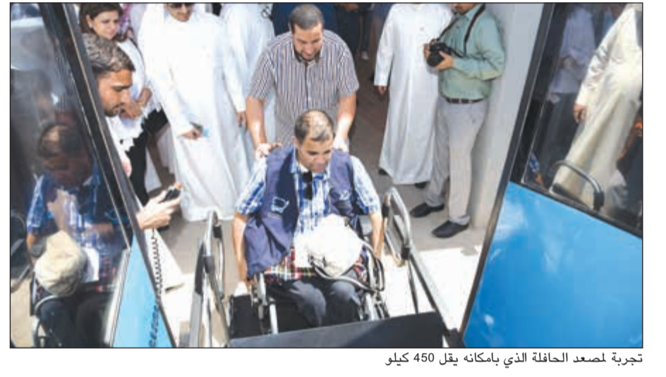
تجربة لمصعد الحافلة الذي بإمكانه يقل 450 كيلوغرام