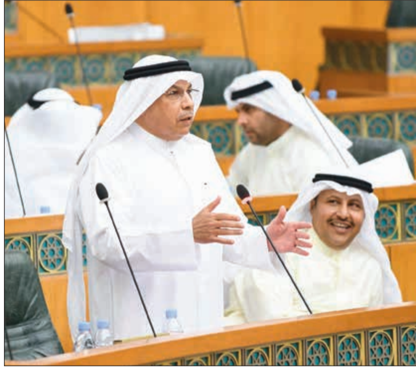
الشيخ خالد الجراح يرد على حديث النواب حول جدية الحكومة في تطبيق القانون على الجميع (ماني الشمري)

أثناء سير جلسة أمس حصلت مشادة كلامية وسجال بين النائبين رياض العدساني والحميدي السبيعي خلال الحديث على بند طلب مناقشة عن تحويلات وإيداعات مالية تخص المجلس الأولي الأسبوعي واللجنة الأولمبية، واستدعى الأمر تدخل بعض النواب لتهدئة الأوضاع حيث كان العدساني والسبيعي متقابلين عن يمين ويسار المنصة.