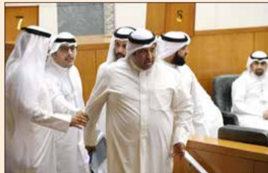
الحميدي السبيعي بعد نهاية السجل بينه وبين العدساني

أثناء سير جلسة أمس حصلت مشادة كلامية وسجال بين النائبين رياض العدساني والحميدي السبيعي خلال الحديث على بند طلب مناقشة عن تحويلات وإيداعات مالية تخص المجلس الأولي الأسبوعي واللجنة الأولمبية، واستدعى الأمر تدخل بعض النواب لتهدئة الأوضاع حيث كان العدساني والسبيعي متقابلين عن يمين ويسار المنصة.