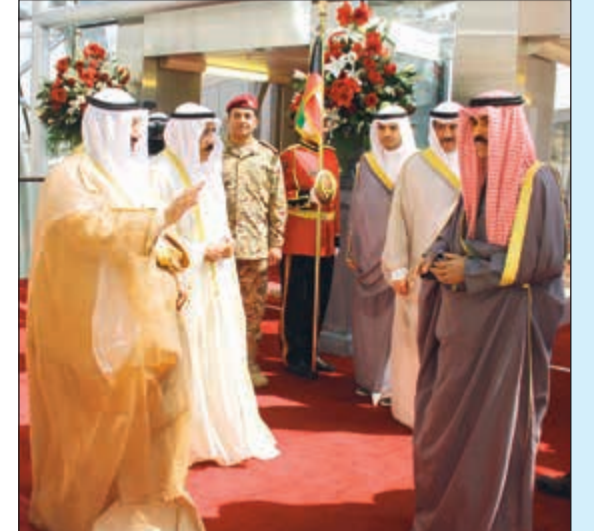
سمو ولي العهد الشيخ نواف الأحمد مغادرا إلى الولايات المتحدة وفي وداعه الشيخ فيصل السعود وسمو الشيخ ناصر الحمد

فيما ألححت الحكومة إلى إمكانية رد القانون، وافق مجلس الأمة في جلسته العادية أمس على المداولة الثانية لتعديل قانون العمل في القطاع الأهلي لجهة صرف مكافأة نهاية خدمة للمتقاعدين ممن عملوا في القطاع النفطي وبأثر رجعي منذ عام 2010 حتى 2017. ورغم التبريرات التي ساقتها الحكومة على لسان نائب رئيس مجلس الوزراء ووزير الدولة لشؤون مجلس الوزراء أنس الصالح وطرحه فكرة تأجيل الأمر لمدة أسبوعين للتقدم بمشروع جديد معدل، وحديث وزير المالية نايف الجحرف عن الآثار المترتبة على إقرار مثل هذا القانون، إلا أن الأغلبية الشيائية كانت ساحقة أمام امتناع السلطة التنفيذية عن التصويت على القانون حيث جاءت الموافقة بـ 43 صوتا وامتناع 10، ورغم تحفظ الحكومة المعلن على قانون التقاعد المبكر بالصورة التي جاء بها من اللجنة المالية البرلمانية، إلا أن المجلس وافق على القانون بمداولة أولى بنسخته النهائية بأغلبية 39 صوتا وعدم موافقة صوت واحد فقط وامتناع 8 تمثّل الجانب الحكومي، وجرى الاتفاق على تأجيل المداولة الثانية لمدة أسبوعين بحيث