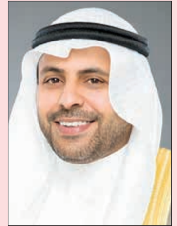
الوزير محمد ناصر الجبري