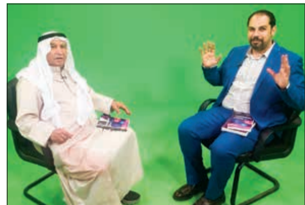
الخضر ويوسف أثناء البرنامج

استضاف الإعلامي أحمد يوسف على قناة النيل الثقافية بالتلفزيون المصري الفنان محمد الخضر، رئيس اللجنة العليا لمهرجان الكويت مركز عربي للنص المسرحي، والذي انتهت فعالياته دورته الثالثة أخيراً لتكريم نجوم الكويت