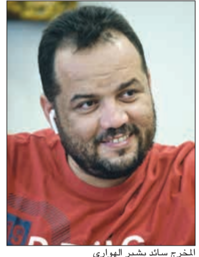
المخرج سائد بشير الهواري