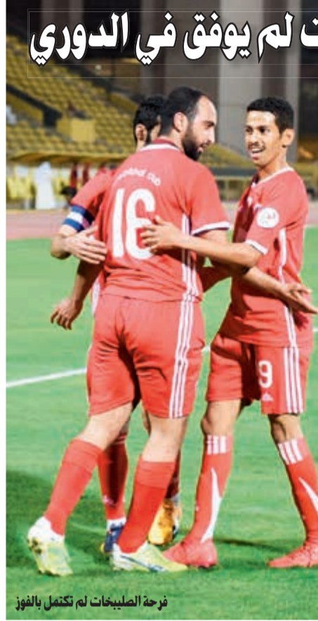
فرحة الصليبخات لم تكتمل بالفوز