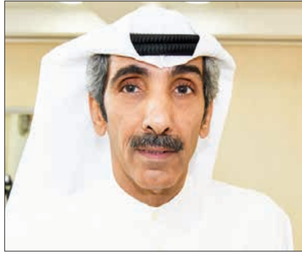
قاسم باشا - محمد هنداري