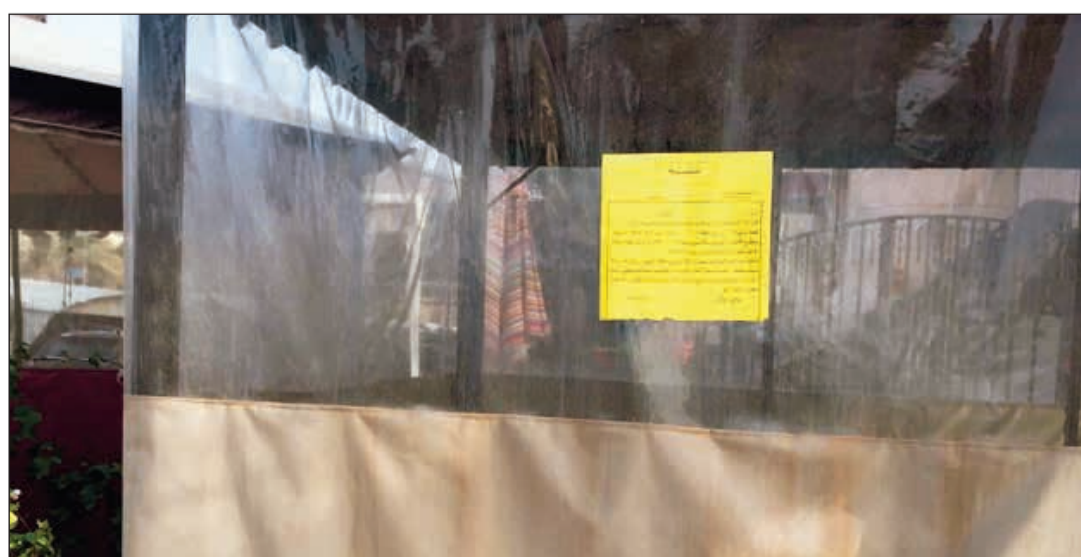
وضع ملصق لإحدى الديوانيات المخالفة

في إطار الجهود المبذولة لتطبيق اللوائح والقوانين والحفاظ على المظاهر الجمالية في مختلف مناطق البلاد، قامت النوبة ب فريق طوارئ مبارك الكبير بإزالة 45 إعلاناً مخالفاً بمختلف الأحجام بالإضافة الي توجيه 3 إنذارات تعديبات على أملاك الدولة لديوانيات وخيام مخالفة. من جانب آخر، قامت إدارة النظافة العامة وإشغالات الطرق في بلدية الجهراء برفع 1026 م3 من الانقاض والمخلفات بالإضافة لكس الشوارع الرئيسية والداخلية والمناطق البرية في المحافظة. كما قام فريق الطوارئ بتحريم 8 مخالفات اعلان، الي جانب إزالة 16 إعلاناً مخالفاً مقاماً على أملاك الدولة في العديد من مناطق المحافظة.