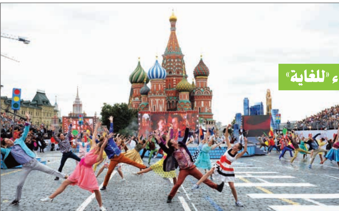
الساحة الحمراء.. قلب روسيا النابض تاريخياً وحاضراً

عندما تصدمك مدينة لينين بليبرالية فاقعة وساحة حمراء «للغاية»