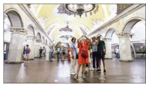
مترو موسكو.. تحف فنية معمارية ووجهة سياحية