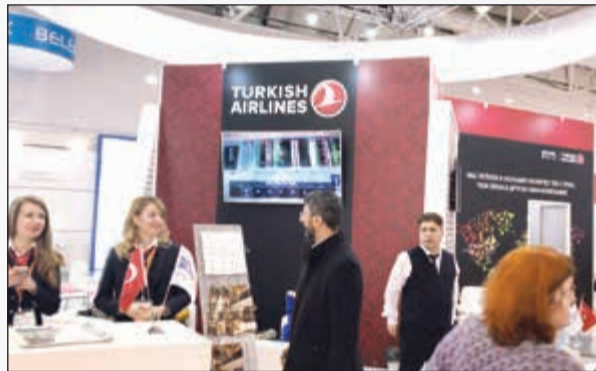
جناح شركة الخطوط التركية في معرض موسكو العالمي للسياحة والسفر (الأبناء)

وتصل «التركية» إلى كل بقاع الأرض، حيث تضم أسطولاً من 338 طائرة ركاب وحسن، وتسير رحلاتها إلى 302 وجهة حول العالم، بما فيها 253 وجهة دولية و49 وجهة محلية. لذلك تقع على رأس شركات الطيران التي اختارها أكبر شريحة من المسافرين حول العالم، خصوصاً في عطلات الصيف، وتعتبر المناطق التالية نقاط القوة ضمن شبكتها: أوروبا، وروسيا، وآسيا الوسطى، والشرق الأقصى، والشرق الأوسط، وأفريقيا، وأمريكا الشمالية والجنوبية. وبفضل خدماتها المميزة من حيث الترفيه على طائراتها ومقاعد المريحة وطعامها الشهي واستخدامها أحدث التكنولوجيا وعرضها أحدث الأفلام والموسيقى واتصالها بـ«الواي فاي»، حصلت «التركية» على أفضل الجوائز العالمية، ويمكن الاطلاع على التفاصيل بزيارة الموقع الإلكتروني www.turkishairlines.com