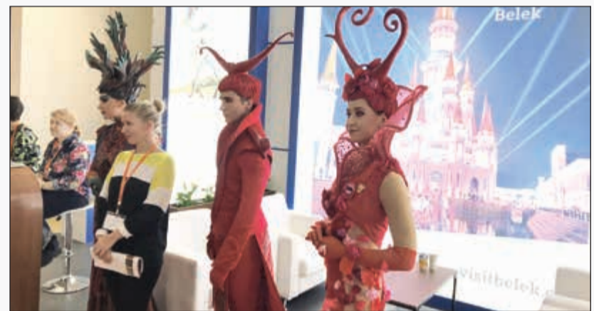
تسويق ميتكو لإحدى المدن التركية

وكان لـ«الأبناء» محطة في موسكو، تعرفت فيها عن قرب على سحر المدن الروسية، عن طريق زيارة معرض موسكو الدولي للسياحة والسفر، أحد أكبر خمسة معارض عالمية متخصصة بالسفر. وكانت الدعوة من شركة الخطوط الجوية التركية التي حجزت وجهتها ركناً خاصاً وضخماً في المعرض. وتطرح الشركة نفسها كقنصل عالمي، يمكن أن ينقل السياح ومحببي كأس العالم من أي مكان في العالم إلى المدن الروسية، وهناك 12 وجهة روسية تصلها الخطوط التركية (انظر تفاصيل الجهات بالكادر المرفق)، وتسير 4 رحلات يومية إلى العاصمة موسكو