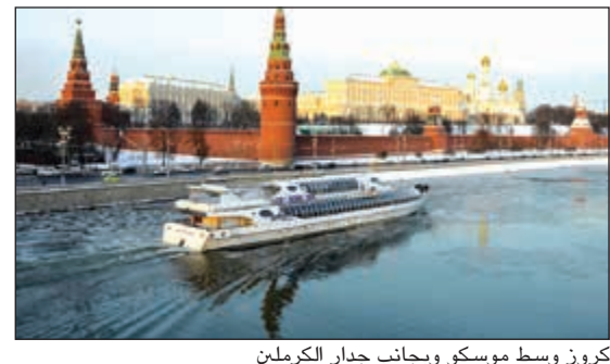
كروز وسط موسكو وبجانب جدار الكرملين