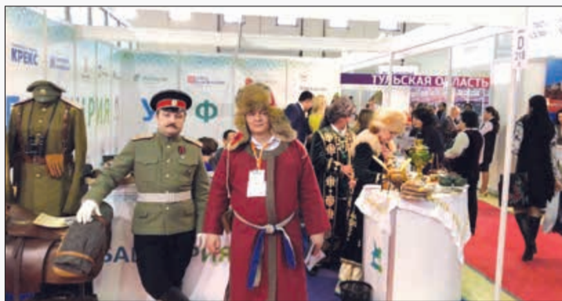
جانب من المشاركات الروسية في معرض موسكو للسياحة والسفر (الأبناء)

تود شركة الخطوط الجوية التركية أن تشكر السفارة الروسية في الكويت والسفير الكسبي سولوماتين على التعاون والمساعدة لإنجاح رحلة العمل التي نظمتها «التركية» لوكلاء وشركات السياحة والسفر في الكويت لحضور معرض موسكو للسياحة والسفر، والتعرف على المدن الروسية عن قرب من خلال المعرض، الذي يعتبر بين أكبر 5 معارض عالمية متخصصة بالسفر ويجمع 1800 شركة من 192 دولة ويحضرها 30 ألف زائر.