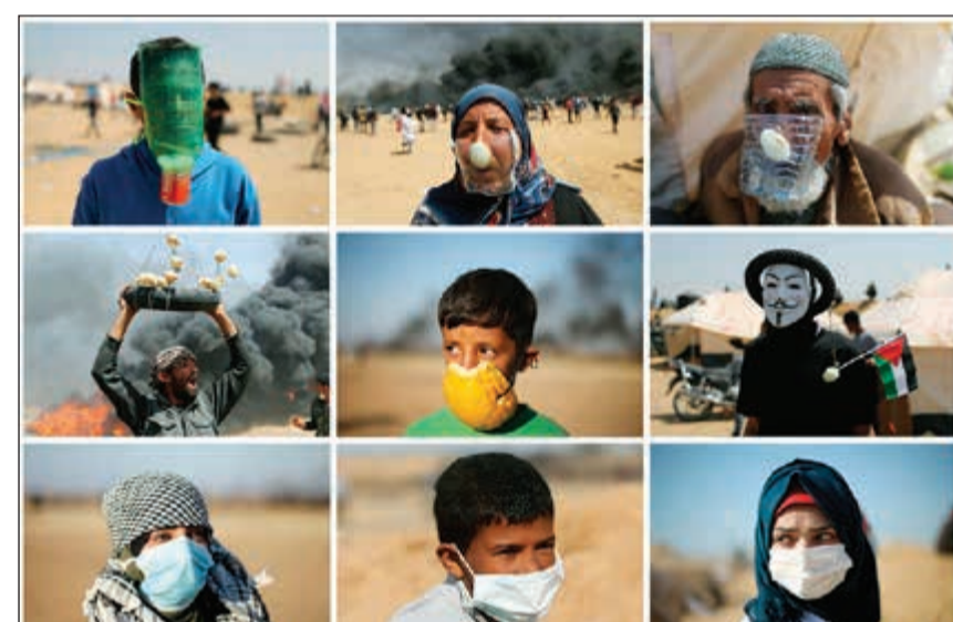
صورة مجمعة للاسلايين التي ابتكرها الفلسطينيون في غزة للحد من آثار القنابل المسيلة للدموع التي يطلقها الاحتلال

الجمعة الثالثة لـ «مسيرات العودة». وزعمت إسرائيل أنها شنت غارات على القطاع ردا على نيران أطلقت من داخله. إلى ذلك، قال مسؤول بارز بالبيت الأبيض لـ «رويترز» إن إدارة الرئيس دونالد ترامب استكملت تقريبا خطة السلام الإسرائيلية-الفلسطينية التي طال انتظارها لكنها ما زالت تواجه صعوبات في تحديد كيف ومتى يمكن طرحها. وأقر بأن واشنطن تواجه مشكلة انقطاع الاتصالات مع الفلسطينيين بسبب اعتزامها نقل السفارة الأميركية إلى القدس.