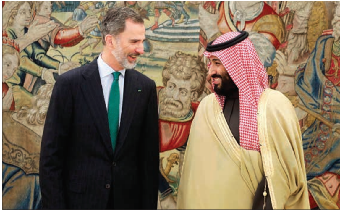
صاحب السمو الملكي الأمير محمد بن سلمان والعهال الإسباني الملك فيليبي السادس عقب مباحثاتهما في مدريد أمس (رويترز)

صغيرة للملكة وأن الصفقة ستشمل قيام الجيش الإسباني بتدريب عسكريين في السعودية على إقامة مركز تشييد بحري هناك. وأشار إلى أن السفن ستباع بنحو 1,8 مليار يورو (2,22 مليار دولار). مصدر وزارة الدفاع السعودية (واس) أن الجانبين بحثا أيضا تطورات الأوضاع في منطقة الشرق الأوسط والعالم، والجهود المبذولة بشأنها بما فيها جهود محاربة الإرهاب ومكافحة التطرف. في غضون ذلك، كشف