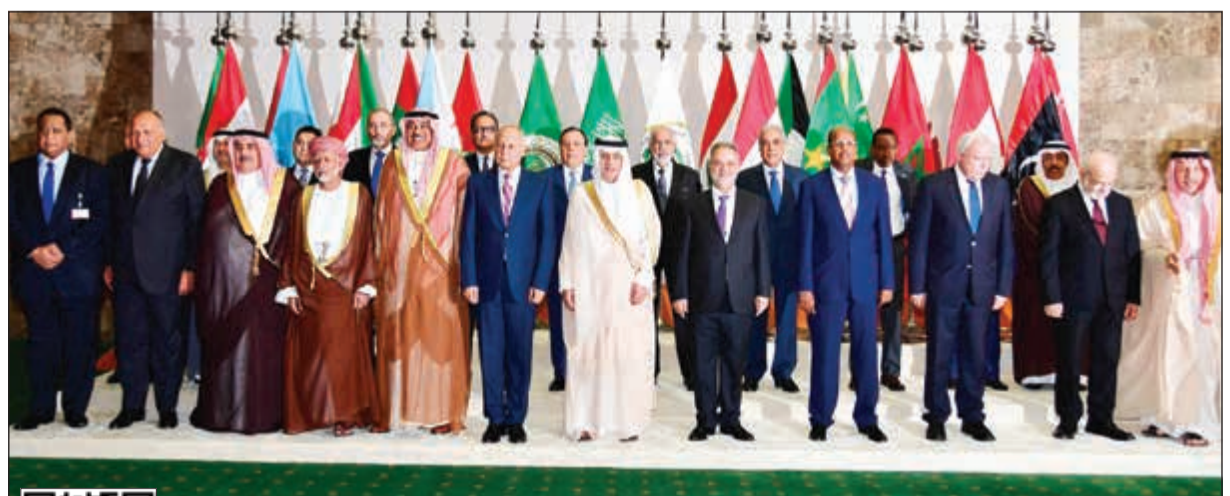
صورة جماعية لوزراء الخارجية العرب قبيل بدء اجتماعاتهم التحضيرية لـ «قمة الدمام» امس

ترأس الشيخ صباح الخالد نائب رئيس مجلس الوزراء ووزير الخارجية لمس وفد الكويت المشارك في اجتماع وزراء الخارجية التحضيري لمجلس جامعة الدول العربية على مستوى القمة في دورته الـ 29 في الرياض. وتم خلال الاجتماع مناقشة جدول أعمال وقرارات القمة العربية التي ستعقد بالمنطقة الشرقية في المملكة العربية السعودية الأحد المقبل والتي سيتم رفعها إلى أصحاب الجلالة والسمو قادة الدول العربية. وعلى هامش الاجتماع، التقى الخالد مع وزير خارجية جمهورية مصر العربية سامح شكري، حيث تم خلال اللقاء الإشادة بمستوى العلاقات التاريخية المتينة بين البلدين وسبل تعزيزها وتنميتها في كل المجالات وعلى مختلف الصعد، كما تم استعراض مجمل المواضيع والقضايا