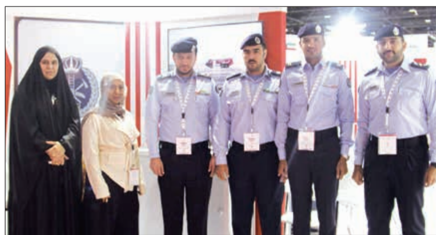
جانب من مشاركة الإدارة العامة للإطفاء في المعرض

وتشارك الإدارة العامة للإطفاء في المعرض بمشروعين الأول جمع عينات الحريق عبر الأجهزة الذكية، والمشروع الثاني خدمات الإدارة العامة للإطفاء الإلكترونية عبر الأجهزة الذكية، وهي المشاريع التي تم ترشيحها