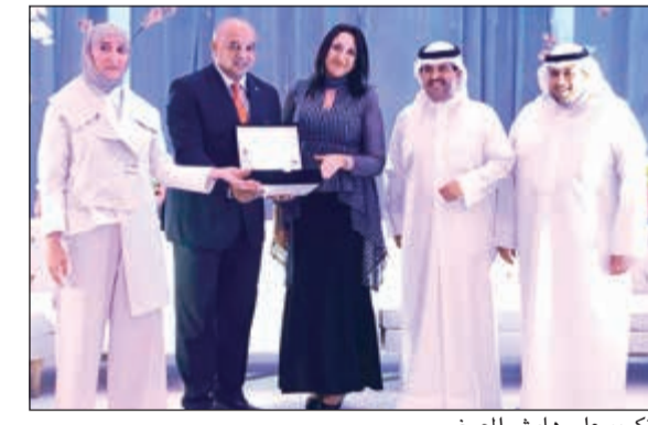
تكريم على هامش المعرض

عشاء مجاني للعروسين في أي من مطاعم الثريا سيتي مع طاولة مميزة، مساج لمدة 30 دقيقة للعروسين في سبا أكوادونيك، خصم 20% على الفاتورة لأي قاعة لحجز لا يقل عن 300 شخص ومميزات إضافية أخرى، على يسار القاعة كانت مساحة مميزة للفندق حيث تم إعداد وعرض مختلف أنواع أدوات المفاتيح الفريدة، كراسي أنيقة وكعبة الزفاف فاخرة، كما قدم أنواعاً مختلفة من المقبلات المألحة والحلويات اللذيذة للزوار. وبهذه المناسبة، قالت