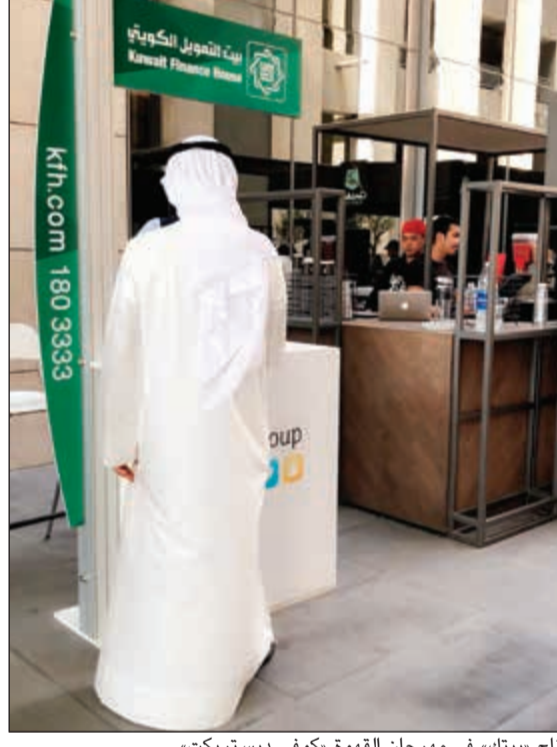
جناح «بيتك» في مهرجان القهوة «كوفي ديستريكت»

حظي مهرجان القهوة «كوفي ديستريكت» الذي اقيم في مجمع الحمراء على مدار يومين برعاية استراتيجية بيت التمويل الكويتي (بيتك)، وبالشراكة مع «Cofe App»، بإقبال لافت من رواد المجمع، وعمالء «حسابي» الذين حصلوا على عروض خاصة من «بيتك». وتأتي هذه المبادرة في إطار المسؤولية الاجتماعية للبنك، والحرص على مكافأة عملاء برنامج «حسابي» للشباب بما يعكس تميز البنك في تقديم أروع العروض والمميزات التي تلي تطلعاتهم وتزيد من رضاهم، كما تعكس المبادرة الحرص على دعم مبادرات ومشاريع الشباب الكويتي وزيادة الأعمال، لاسيما في ظل الإقبال اللافت من الشباب الكويتي على إطلاق مشاريع تتعلق بصناعة القهوة التي باتت تحظى بزخم كبير في الكويت والعالم، إذ افتتح المهرجان المجال أمام الشباب الكويتي للتعرف على صناعة القهوة وطريقة تحضيرها وأنواع القهوة والنكهات والمذاقات المميّزة، والمعايير الأفضل لتحضير القهوة وطحنها وتقطيرها. وجمع المهرجان 13 من محلات القهوة المحلية والعالمية والمختصين واصحاب المشاريع في صناعة القهوة تحت سقف واحد، الأمر الذي ساهم في استقطاب أعداد كبيرة من الزوار وعشاق القهوة بمختلف الفئات العمرية، ويتواجد «بيتك» في جناح خاص في المهرجان ينظم من خلاله أنشطة خاصة للرواد والعملاء. ويعتبر تطبيق «Cofe App» المنخصص في القهوة مبادرة كويتية وهو من التطبيقات المتميزة كونه يهدف إلى جمع جميع محلات القهوة المحلية المتميزة وموردي ومحمصي القهوة في تطبيق واحد، بالإضافة إلى سهولة استخدام التطبيق وطريقة الدفع الإلكتروني وخدمة التوصيل وغيرها من المميزات.