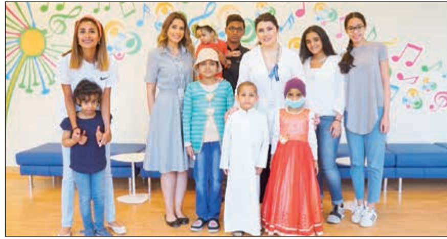
فريق البنك الوطني مع الأطفال في المستشفى

من العام 1967 لتكون مناسبة سنوية لتشجيع الأطفال على حب المطالعة وتعزيز حب القراءة لديهم، بالإضافة إلى نشر الوعي العالمي بشأن أهمية كتب وقصص الأطفال. وقد تشارك الأطفال في المستشفى قصصاً مختلفة بينهم، بعضهم يعرفها أما البعض الآخر فقد تعرف على قصص جديدة، وقد ساهمت هذه المناسبة بترويض العلاقة بينهم وبين الكتب، ويواصل بنك الكويت الوطني برنامجه السنوي لنشاطات مستشفاه التخصصي، ويشمل إلى