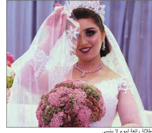
إطلالة رائعة ليوم لا ينسى

شاركت نخبة من أبرز المصممين ومنظمي حفلات الزفاف في المعرض، وقد قدم فندق كراون بلازا الكويت «الثريا سيتي» عروض خاصة ومزايا حصرية عند حجز زفافك حفل زفافك خلال ثلاثة أيام المعرض، مثل ليلتين إقامة مجانية،