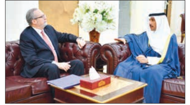
رئيس مجلس الأمة مرزوق الغانم لدى استقباله السفير الأميركي

كما استقبل الغانم سفير جمهورية الفلبين لدى الكويت ريناتو فيللا.