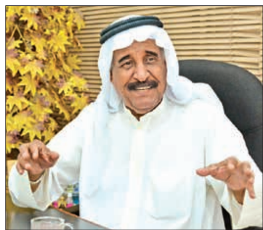
الفنان القدير محمد جابر