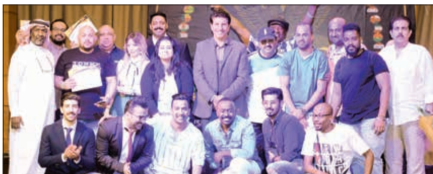
فرقة المسرح الشعبي وجوائز «يوميات أدت إلى الجنون»