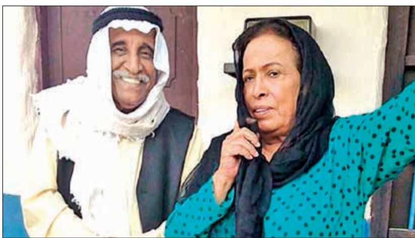
.. ومع الفنانة القديرة حياة الفهد في «بيعة النخيل»