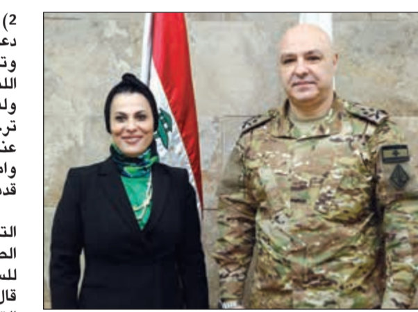
قائد الجيش اللبناني العماد جوزف عون مع مرسله «كونا»، فرح الفرج

حيث أكد المجتمع الدولي دعمه لاستقرار لبنان وإشادته وتقديره بالأجهزة الأمنية اللبنانية وخصوصا الجيش. ولفت إلى أن الجيش ينتظر ترجمة الدعم المالي الذي أعلن عنه في المؤتمر لتطوير قدراته وامكانياته وفق الخطة التي قدمها خلال المؤتمر. وحي المعركة العسكرية التي قام بها الجيش اللبناني الصيف الماضي واستعادته للسيطرة على الحدود الشرقية قال العماد جوزف عون «أن التهديد العسكري المباشر للجماعات الإرهابية انتهى بانتهاء المعركة العسكرية الال ان التهديد الأمني مازال ناجسا يعاني منه لبنان كما العالم بأجمع».