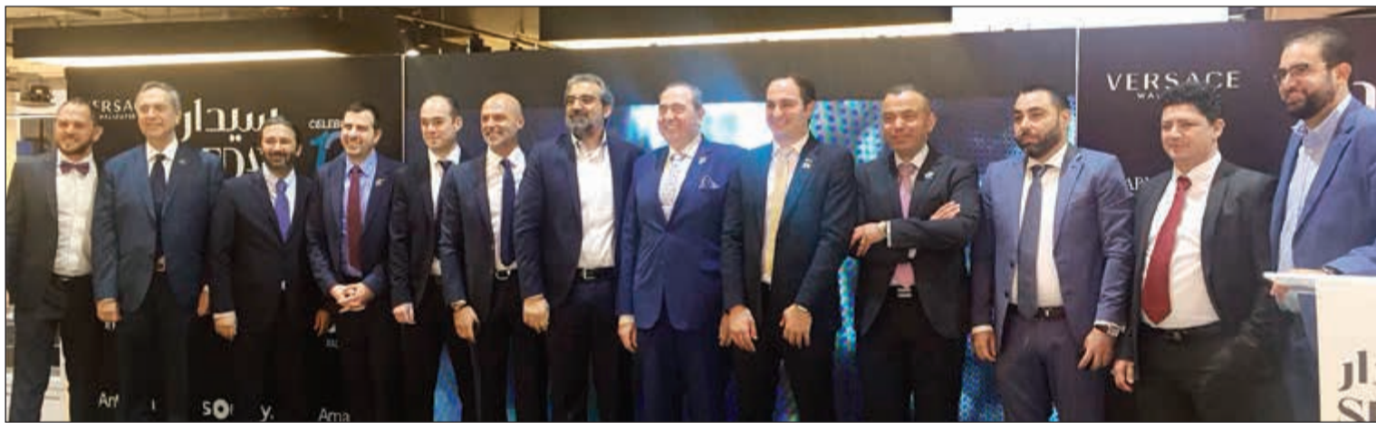
صورة تذكارية لمجموعة سيدار جلوبل