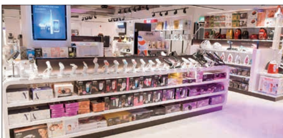
اكسسوارات لجميع أنواع السائز

أفضل التصاميم العصرية التي تناسب متطلبات كل منطقة ودولة على حدة. من جهته، قال شهيد خان، الرئيس التنفيذي لمجموعة الباقوت: «نفخر بشراكتنا مع شركة «سيدار» في الكويت، كما نشدد على حرص مجموعة الباقوت الدائم على تقديم خدمة عملاء لا تضاهي. ونحن سعداء جداً بالتعاون مع «سيدار» في كيو ستور الذي يوفر تجربة تسوق عصرية للعملاء من خلال تقديم مجموعة متنوعة واستثنائية من منتجات سيدار المواكبة لأحدث خطوط الموضة».