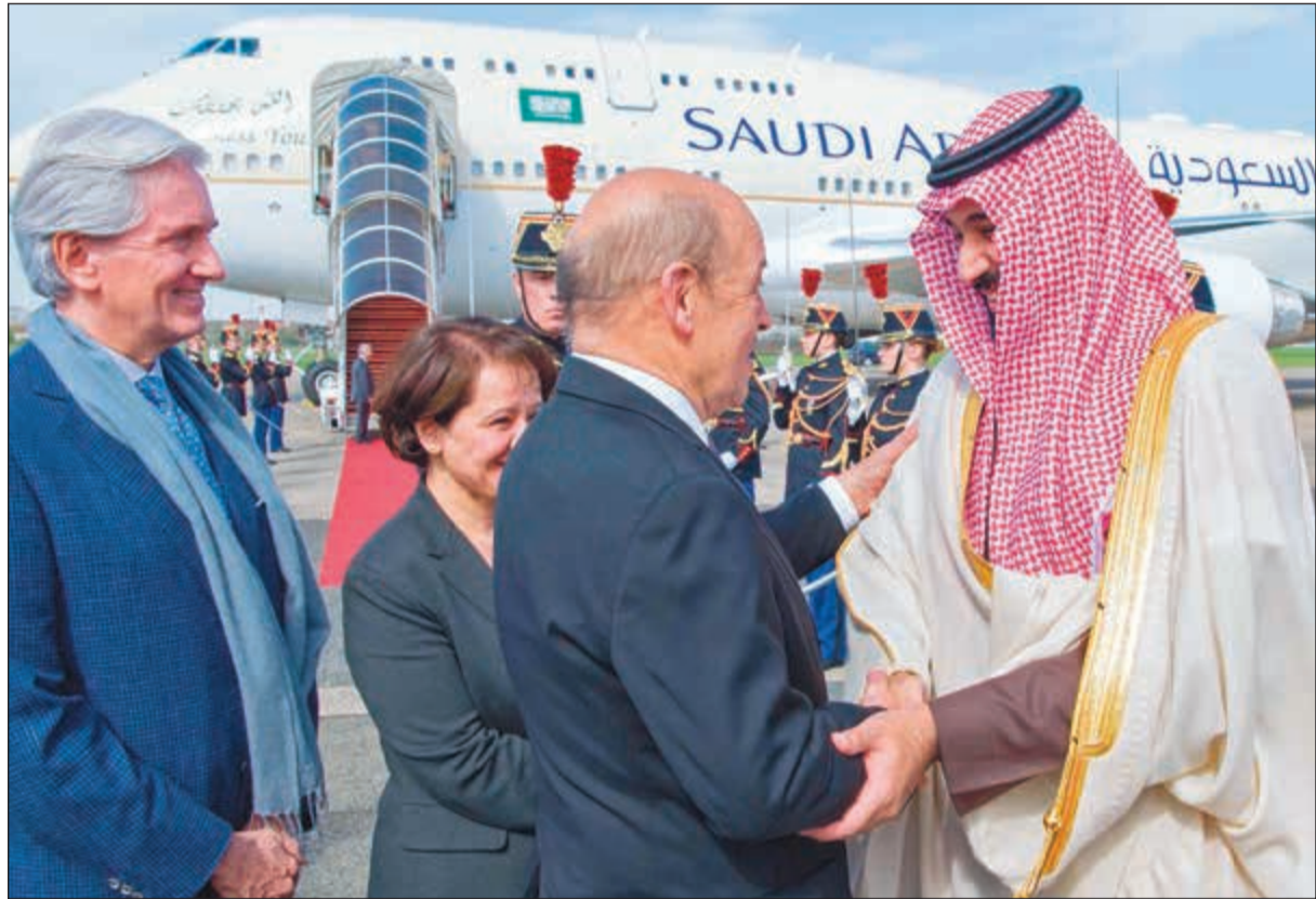
صاحب السمو الملكي الأمير محمد بن سلمان لدى وصوله باريس أمس وفي استقباله وزير الخارجية الفرنسي جان لو دريان

جاء ذلك في تسجيل مصور مدته ساعة و 17 دقيقة ألقى فيه الدوري كلمة