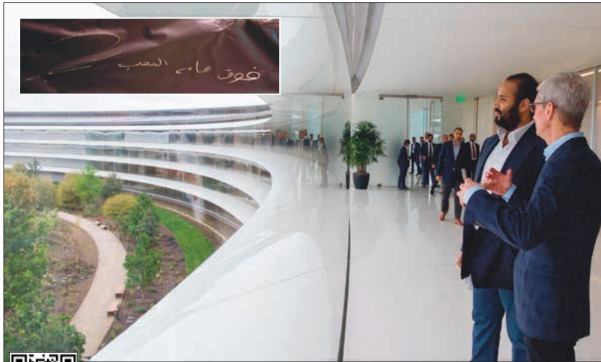
صاحب السمو الملكي الأمير محمد بن سلمان والرئيس التنفيذي لـ «آبل» تيم كوك في مقر الشركة بوادي السيليكون أمس وفي الإطار عبارة «فوق هام السحب» التي كتبها ولي العهد السعودي على أول قمر اتصالات للمملكة (العربية.نت)

قناة «العربية» الفضائية إن موصفات القمر الاصطناعي السعودي تعتبر أفضل ما توصلت إليه التقنية في مجال الأقمار الاصطناعية. وبين أنه بعد من أحدث الأقمار الاصطناعية من حيث موصافاته التقنية المتقدمة والتي تستخدم في الفضاء لأول مرة. ويتميز هذا القمر باستخدام