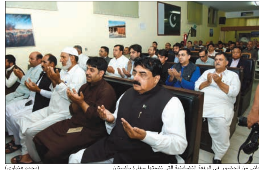
جانب من الحضور في الوقفة التضامنية التي نظمها سفارة باكستان (محمد هندواي)

وذلك في مقر إقامته بحضور عدد من أبناء الجالية - كشف عن التشابه الكبير بين القضيتين الفلسطينية والكشميرية اللتين تواجهان تعنتا ملحوظا في تطبيق قرارات الشرعية الدولية داعيا المجتمع الدولي لسرعة إيجاد حل لهاتين القضيتين. وعن المناسبة قال: نأسف لاستمرار الأحداث الدموية في إقليم كشمير والتي تستهدف العزل من المحتجين باستخدام القوة المفرطة والرقاص الحي، مشيدا بمساندة منظمة الدول الإسلامية واستنكارها لما يحدث في كشمير. وأوضح أن حكومة بلاده قد دعت لهذه الوقفة التضامنية في مختلف بقعها الدبلوماسية.