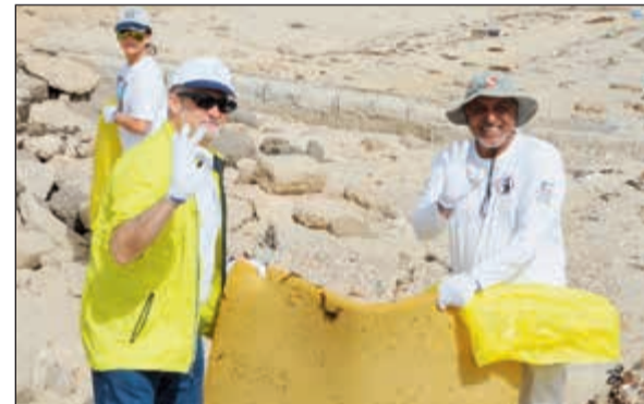
السفير لورانس سيلفرمان ووليّد الفاضل يتشاركان في تنظيف الشاطئ

وأضاف الحويل أن هذه الحملة التي نظّمها الفريق بالتعاون مع السفارة الأمريكية في الكويت والجيش والهيئة العامة للبيئة وبلدية الكويت ومتطوعين تأتي ضمن برنامج الحملات المتنقلة لتنظيف الشواطئ، وبين أنه تم عرض معلومات بالصور عن أهمية المحافظة على البيئة البحرية والساحلية. وأشار إلى أن مشاركة جهات عدة في الدولة في هذه الحملة يدل على حرصها على نظافة شواطئنا وحج العمل التطوعي، لافتا إلى أن الدراسات العلمية الأخيرة تشير إلى أن كميات البلاستيك الموجودة في البحار تبلغ ثلاثة أضعاف مساحة فرنسا ما يتطلب ضرورة التدخل لوقف التلوث وتشدّد العقوبات على المخالفين ووقف التعديلات.