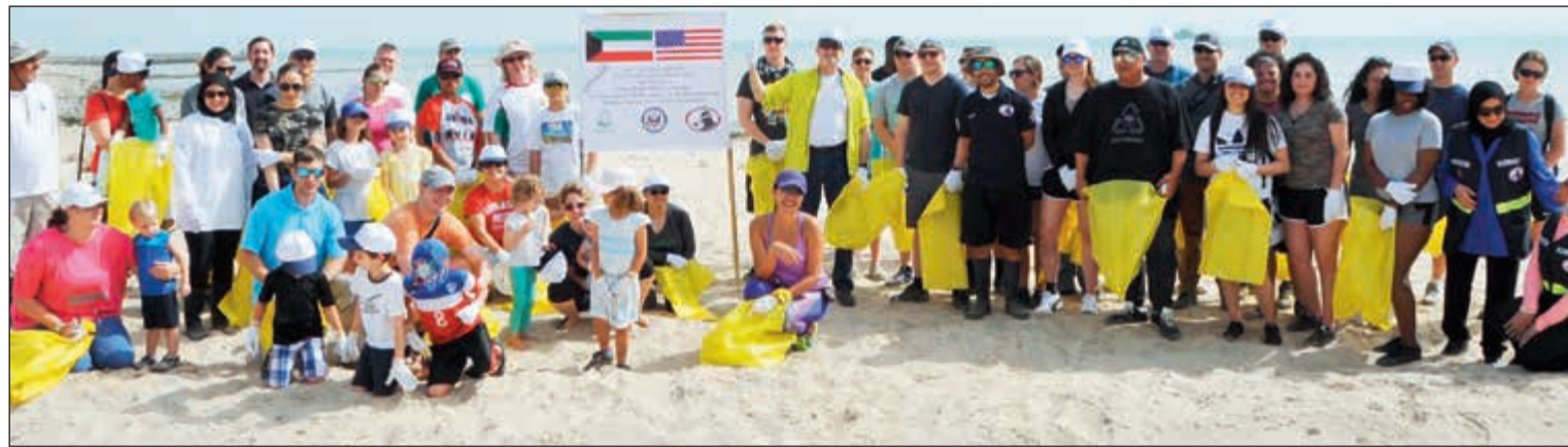
السفير لورانس سيلفرمان وعدد من أعضاء فريق الغوص مع المشاركين في حملة تنظيف شاطئ أنجفة (عادل سلامة)