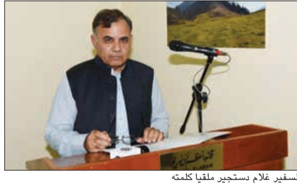
السفير غلام دستجير ملقيا كلمته

وذلك في مقر إقامته بحضور عدد من أبناء الجالية - كشف عن التشابه الكبير بين القضيتين الفلسطينية والكشميرية اللتين تواجهان تعنتا ملحوظا في تطبيق قرارات الشرعية الدولية داعيا المجتمع الدولي لسرعة إيجاد حل لهاتين القضيتين. وعن المناسبة قال: نأسف لاستمرار الأحداث الدموية في إقليم كشمير والتي تستهدف العزل من المحتجين باستخدام القوة المفرطة والرقاص الحي، مشيدا بمساندة منظمة الدول الإسلامية واستنكارها لما يحدث في كشمير. وأوضح أن حكومة بلاده قد دعت لهذه الوقفة التضامنية في مختلف بقعها الدبلوماسية.