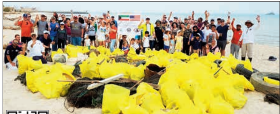
من حصيلة الحملة