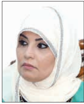
الشيخة فوزية الصباح