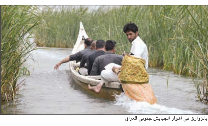
رحلة بالزوارق في اهوار الجبايش جنوبي العراق

واوضح الاسدي ان الاهوار ادرجت قبل اكثر من عام ضمن لائحة التراث العالمي في اجتماع منظمة الأمم المتحدة للتربية والعلم والثقافة (يونسكو) بذورته التي عقدت في اسطنبول منوها بدور الوفد الكويتي في المؤتمر والذي كان له اثر كبير في دعم الملف.