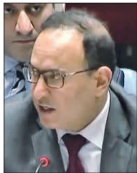
السفير منصور العتيبي

منصور العتيبي أمس الأول في جلسة مجلس الأمن بشأن ملف الأسلحة الكيميائية في سورية. وقال العتيبي إن «مناقشة ملف الأسلحة الكيميائية في سورية وهو الذي كان يحظى بتوافق مميز ما بين جميع أعضاء المجلس في إطار الأزمة السورية وكانت نتيجة هذا التوافق وجود آلية لمحاسبة مرتكبي الجرائم التي ارتكبت في سورية باستخدام الأسلحة الكيميائية واستطاعت هذه الآلية تحديد مسؤولية هذه الأطراف التي كانت وراء عد من تلك الجرائم في سورية». وأضاف أن «الآلية تمكنت من