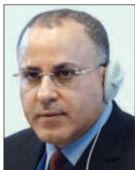
السفير جمال الغنيم

استضافته الأمم المتحدة ليوم واحد. وأضاف أن كلمة نائب وزير الخارجية خالد الجارالله وما احتوته من مضامين على الصعيد السياسي والإنساني فيما يتعلق بقضايا اليمن حازت ثناء وتقدير العديد من الدول والمنظمات الدولية الإنسانية المشاركة في أعمال هذا المؤتمر. وأكد الغنيم أن «الكويت بعثاتها الإنسانية الذي تجلى خلال أعمال المؤتمر تؤكد مرة أخرى ريادتها في العمل الإنساني الذي تحت