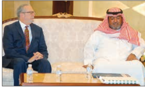
الشيخ ثامر العلي خلال لقائه السفير الأميركي لدى البلاد لوران سيلفمان

بحث رئيس جهاز الأمن الوطني الشيخ ثامر العلي مع السفير الأميركي لدى الكويت لوران سليفمان عدداً من الموضوعات ذات الاهتمام المشترك. وقال الجهاز في بيان صادر عن إدارة العلاقات العامة ان اللقاء بين الجانبين تطرق الى استعراض أوجه التعاون وبحث العلاقات الثنائية التي تجمع بين البلدين الصديقين وسبل تعزيزها وتطويرها، إضافة إلى اهم القضايا المشتركة التي تهم البلدين على الساحتين الإقليمية والدولية. وذكر البيان ان الشيخ ثامر الصباح قام بعد اللقاء برفقه السفير الأميركي بترقيم عدد من منسوبي الجهاز بتوزيع شهادات تخرجهم في دورة أقيمت بالتعاون مع الجانب الأميركي.