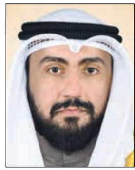
الشيخ د. باسل الصباح

ديبي-كونا: منحت الأكاديمية العربية للأذن وزراعة القوقعة وزير الصحة الشيخ د.باسل الصباح الرئاسة الفخرية للأكاديمية وذلك على هامش فعاليات المؤتمر العربي الأول لجراحة الأذن وزراعة القوقعة التي انطلقت أمس في دبي.