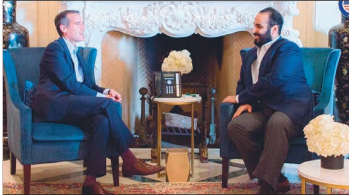
صاحب السمو الملكي الأمير محمد بن سلمان خلال لقائه عمدة لوس أنجلوس إيريك جارسيستي (واس)

عواصم - واس - وكالات: التقى صاحب السمو الملكي الأمير محمد بن سلمان ولي العهد نائب رئيس مجلس الوزراء وزير الدفاع السعودي بمقر إقامته في لوس أنجلوس امس رئيس مجلس الإدارة الرئيس التنفيذي لشركة والت ديزني روبرت بوب آلن إيجر. وذكر وكالة الأنباء السعودية الرسمية (واس) في بيان أنه جرى خلال اللقاء استعراض فرص التعاون في قطاعات الترفيه والثقافة وصناعة الأفلام.