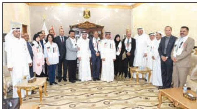
محافظ ذي قار يحيى الناصري والسفير يوسف الصباح مع أعضاء الوفد الإعلامي الزائر (هاني الشمري)

محافظ ذي قار يحيى الناصري للوفد الإعلامي الزائر: تسهيلات كبيرة وفرص واعدة ومهمة وجاذبة للمستثمرين الكويتيين 15