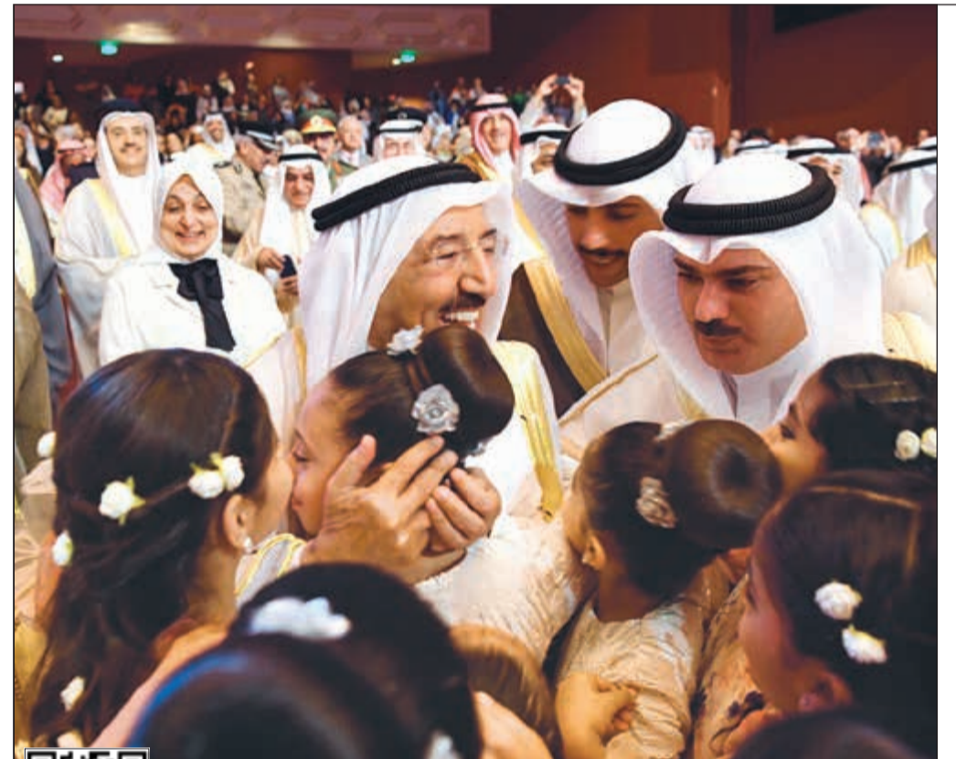
صاحب السمو الأمير الشيخ صباح الأحمد في لفظة أبوية مع عدد من الزهرات المشاركات في أوبريت «عجيبه هالديرة»

أكدت مصادر مطلعة في تصريحات خاصة لـ «الأنباء» أن مجلس الخدمة المدنية سيجدد استمرار العمل بقرار وقف النقل والندب للموظفين بين الوزارات والهيئات والجهات الحكومية، للعام السابع على التوالي، والمعمول به منذ العام 2013. وبينت المصادر أن هناك توافقاً حكومياً - نيابياً على استمرار تطبيق قرار وقف النقل والندب بين الوزارات والجهات الحكومية الذي حقق العدالة والشفافية لجميع موظفي الدولة من دون تفضيل أو تمييز لأي موظف. ولقتت المصادر إلى أن نظام التوظيف يتيح التسجيل مجدداً للمستقلين الذين لا يرغبون في الاستمرار في الجهة التي يعملون بها حالياً، فضلاً عن أن ديوان الخدمة المدنية يفتح المجال حتى بعد الترشح في تغيير الجهة التي يتم الترشح إليها، بالإضافة إلى وجود حرية اختيار الجهة التي