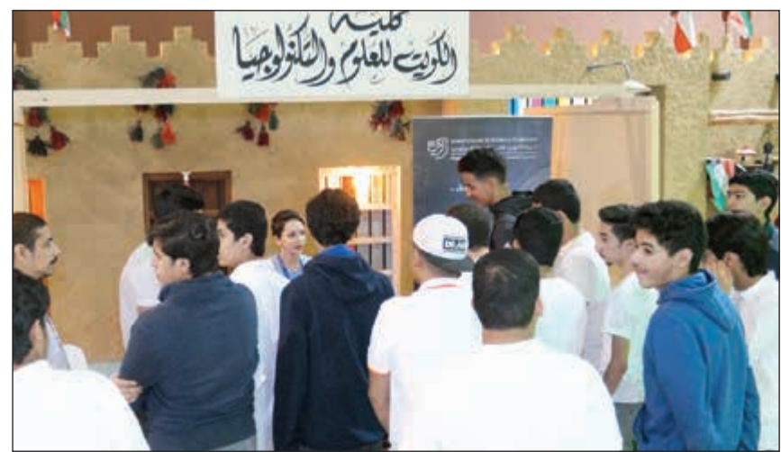
جناح كلية الكويت للعلوم والتكنولوجيا في المعرض

القبول للجامعة وتقديم للبعثات الداخلية. وأشاد رئيس الجامعة