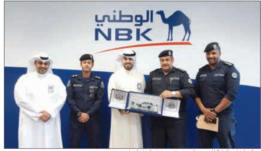
ممثلو الإدارة العامة للمرور يكرمون فريق عمل البنك الوطني

المتواصلة التي تقوم بها الإدارة العامة للمرور ووزارة الداخلية حفاظا على سلامة وأمن المواطنين، وأشاد