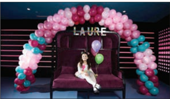
أجواء مميزة للأطفال

قررت إدارة فندق سيمفوني ستايل الكويت، جوهره مدينة الكويت، استكمالاً لما إقاه نادي سيمفوني للأطفال من شعبية واسعة بوصفه محطة ترفيهية تلبى رغبات ضيوف ترفيهي، ووجهة مميزة للعب وإقامة حفلات الأطفال في الكويت، تعزيز تجربة الضيوف الصغار في الفندق مع إطلاق «التيينز هاب» للباقيين و«بارتي روم» لإقامة أروع الحفلات التي لا تنسى للأطفال. يقع «التيينز هاب» في الطابق الثالث الذي تم تجديده مؤخراً، كمساحة ترفيهية مفعمة بالحيوية والنشاط ومصممة خصوصاً للباقيين والباقيات، لتتيح للضيوف الاستمتاع بأحدث ألعاب الفيديو مثل الوي والبلاي ستيشن إلى جانب منصة الألعاب التفاعلية التي توفر تجربة الواقع الافتراضي ماجيك موشين أو حتى إقامة حفلات أعياد الميلاد وسط أجواء مليئة بالحفاوة والتسليّة. بينما توفر قاعة الحفلات مساحة داخلية مثالية لإقامة حفلات أعياد ميلاد الأطفال أو الاحتفالات العائلية مع باقات خاصة ومصممة بما يتوافق مع متطلبات ورغبات الأطفال. في