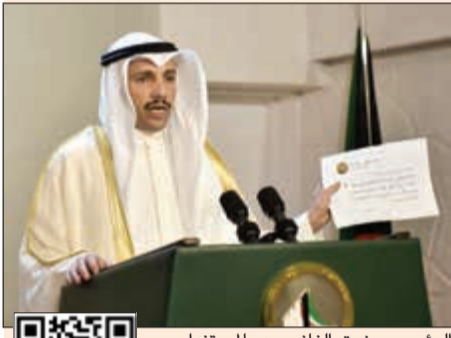
الرئيس مرزوق الغانم يرد بالمستندات على الشكاوى المقدمة ضد الكويت

الغانم يفند بالوثائق والمستندات الادعاءات الباطلة التي تضمنتها الشكاوى المقدمة ضد الكويت في «البرلماني الدولي»