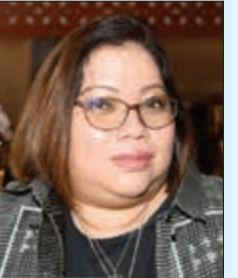
سارة لو ريو لا

نائبة وزير خارجية الفيلين لـ «الأنباء»: اتفاقية العمالة مع الكويت ستمثل الأساس للتفاوض مع باقي الدول