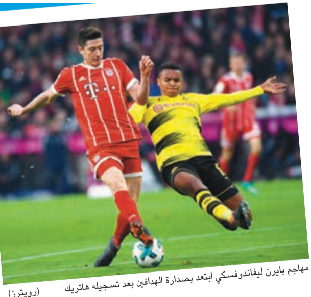
مهاجم بايرن ليفاندوفسكي ابتعد بصدارة الهدافين بعد تسجيله هاتريك

سحق بايرن ميونيخ غريمه بوروسيا دورتموند 6-0 بثلاثية لهدافه البولندي روبرت ليفاندوفسكي لكن تتويجه تاجل بعد فوز شالكه الثاني أمس في المرحلة 28 من الدوري الألماني لكرة القدم. وكان بايرن بحاجة للفوز مقابل تعثر شالكه، بيد أن الأخير تخطف عقبة فرايبورغ 2-0، ليبقى على فارق النقاط الـ17 بينهما. وسيضمن بايرن احراز لقبه الثامن والعشرين السبت المقبل، بحال فوزه على أرض أوغسبورغ، بغض النظر عن نتيجة شالكه. على ملعب «اليانز أرينا» وأمام مدرجات ممتلئة 75 ألف متفرج، سجل أهداف بايرن البولندي روبرت ليفاندوفسكي (5 و44 و87 رافعا رصيده إلى 26 هدفا في صدارة ترتيب الهدافين). والكولومبي خاميس رودريغيز