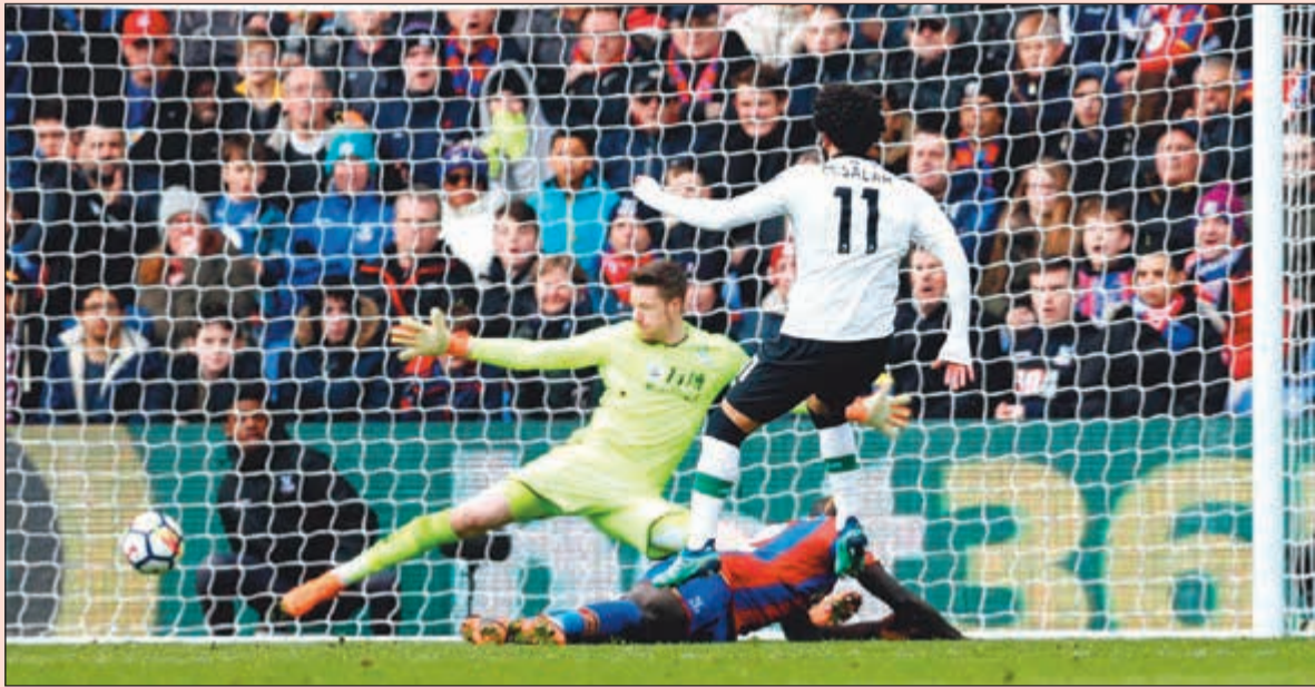
نجم ليفربول محمد صلاح سجل هدفا في الوقت القاتل

الخطأ ممنوع على البلوز أمام السبيرز.. وروما يسقط بالتعادل