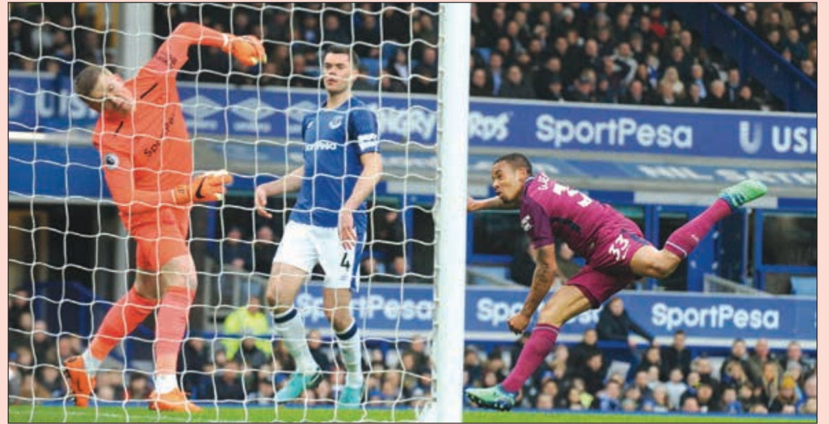
غابرييل جيسوس يسجل الهدف الثاني لمان سيتي