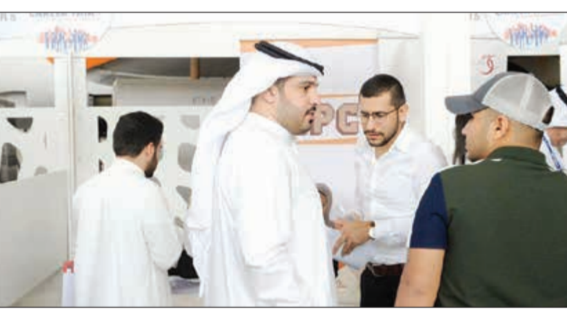
إقبال على جناح «المعامل» في المعرض

فإنها تنسجم بمجموعة ملامح رئيسية أهمها الارتقاء بقرارات ومواردها البشرية، وإعداد قيادات وطنية تكون قادرة على استكمال مسيرة التطور. وتكررت أن شركة «المعامل» كانت متواجدة في فعاليات المعرض من خلال ركنها الخاص، لتعريف زوار المعرض ببيئة عملها المميزة، ونوعية وشروط الوظائف التي لديها، إضافة إلى تقديم شرح تفصيلي عن طبيعة عمل مختلف الإدارات والأقسام. واختتمت المساعدين