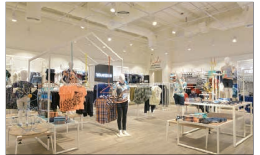
أزياء رائعة للأطفال

الأطفال ومستلزمات البيت بالألوان الخشبية والسيراميك، وتمتد الواح رمادية اللون في قسم الملابس الرجالية، مما يوحى بتواجد أقسام مختلفة لتوجيه زوار المحل في رحلة تسوق سلسة.