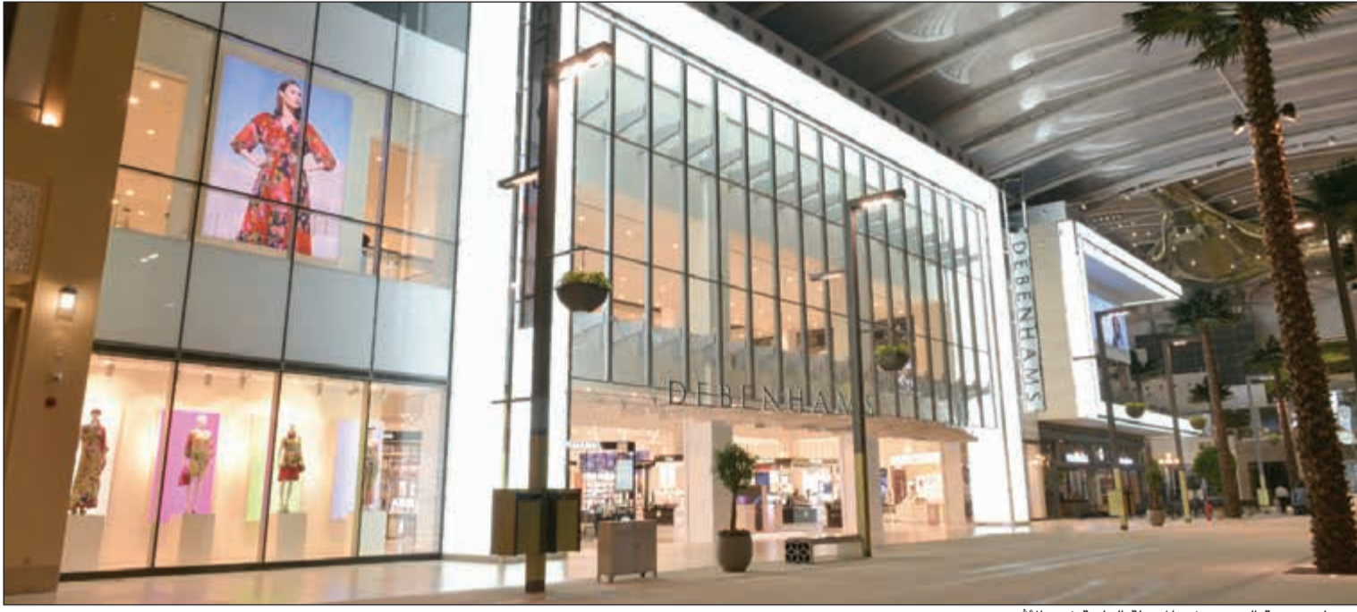
«دبنهايمز» متعة التسوق في المرحلة الرابعة في «الأفنيوز»