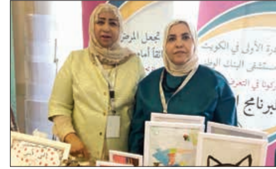
دمني بورسلي خلال الملتقى

جمعية «أبي أتعلم» العام الماضي في مستشفى البندك الوطني التخصصي للأطفال وحالياً الجمعية تشرف وتدير هذا الفصل الدراسي ليتمكن الأطفال مواصل تعليمهم ومسيرة أقرانهم أكاديمياً، ويمكن التواصل مع الجمعية من عبر منصات التواصل الاجتماعي TWTL الخاصة بالجمعية.