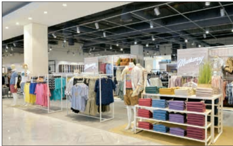
ملابس من أرقى العلامات التجارية