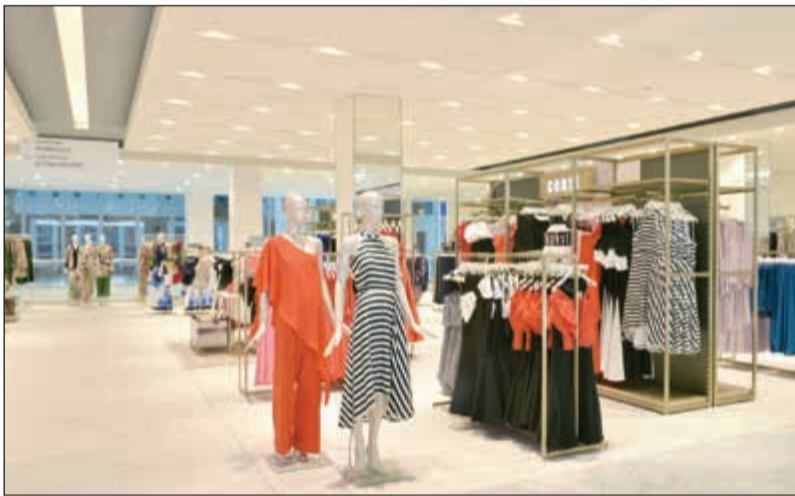
ملابس نسائية مميزة وأنيقة

يمتد على مساحة 3 طوابق ضمن المرحلة الرابعة بـ «الأفنيوز»