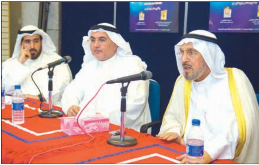
الراحل خلال ندوة التيار الإسلامي بين الامس واليوم