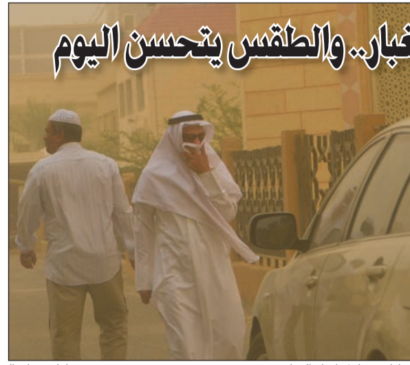
مواطن يحاول اتقاء الغبار (قاسم باشا)

كما كان متوقعا خيم الغبار على الأجواء أمس وأدى إلى انخفاض الرؤية الأفقية. وقال مراقب التنبؤات الجوية في إدارة الأرصاد الجوية عبدالعزيز القراوي إن هذه الحالة من عدم استقرار نتجت عن نشاط رياح شمالية غربية مخرية للغبار تجاوزت سرعتها 60 كيلومترا في الساعة، لافتا إلى أن الرؤية الأفقية انخفضت إلى أقل من 500 متر في أغلب المناطق. وتوقع القراوي أن يتحسن الطقس اليوم تدريجيا وتكون الرياح شمالية غربية خفيفة إلى معتدلة السرعة تنشط على فترات وتتراوح ما بين 15 و40 كيلومترا في الساعة وتظهر سحب متفرقة، فيما تكون درجات الحرارة العظمى المتوقعة ما بين 30 و33 درجة مئوية والبحر خفيفا إلى معتدل الموج يعلو أحيانا وارتفاعه ما بين 2 و6 أقدام.