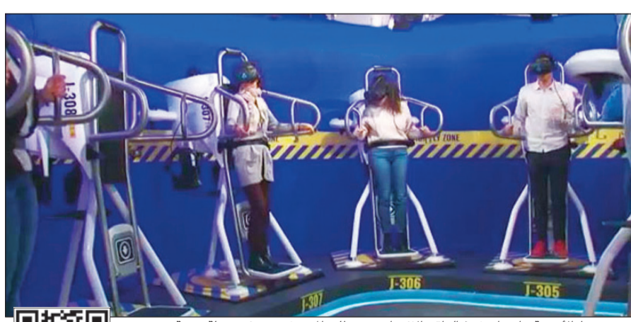
بمجرد ربط الأحزمة وارتداء خوذ الواقع الافتراضي ينطلق المستخدمون في رحلة جوية