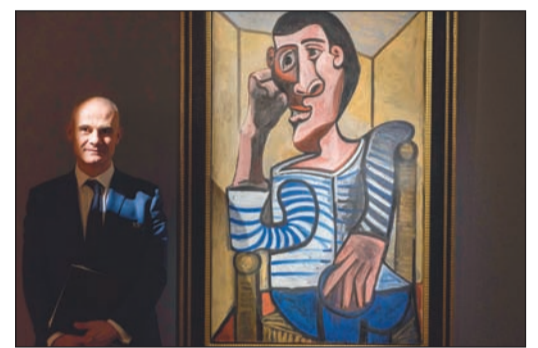
اللوحة لدى عرضها في هونغ كونغ

هونغ كونغ - أ.ف.ب: تعززت دار «كريستيز» طرح رسم ذاتي لبيكاسو بأثر من نوعه، في مزاد يقام في نيويورك، مقدرة أن يصل سعر هذه اللوحة إلى 70 مليون دولار. وهذه اللوحة الزيتية الممتدة على 130 سنتيمترا طولاً و81 عرضاً والتي تحمل اسم «البحار» تظهر رجلاً حزيناً يرتدي قميصاً مقلماً ويجلس على كرسي. وهي معروضة في هونغ كونغ حتى الثالث من أبريل قبل نقلها إلى لندن ثم نيويورك حيث ستطرح في مزاد من المقرر تنظيمه في الخامس عشر من مايو.