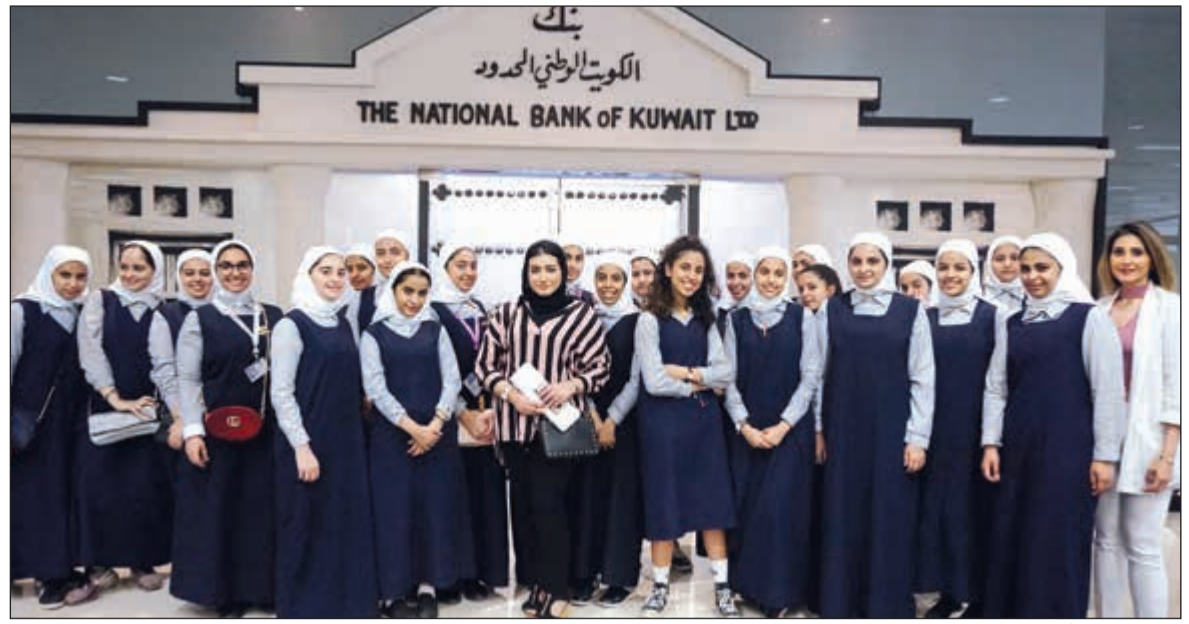
طالبات ثانوية أم الحكم خلال زيارة «الوطني»

وأوضحت أن الاستراتيجية تستهدف رفع عدد العاملين من الكويتيين في القطاع الخاص إلى 100 ألف عامل خلال 3 سنوات مدة تنفيذ الاستراتيجية في 2021، لافتة إلى أن كل البرامج التي يتم وضعها حاليا تهدف لتحقيق ذلك مشيدة بتعاون القطاع الخاص في هذا الشأن.