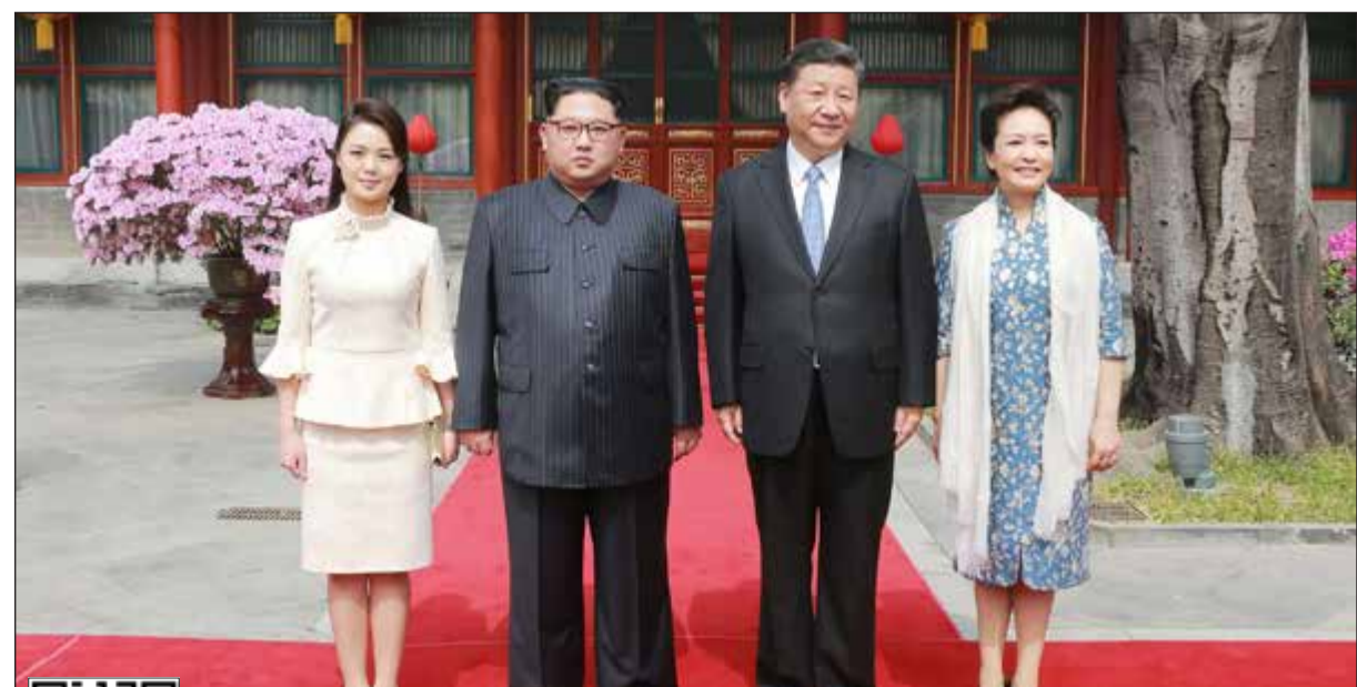
صورة للرئيس الصيني والزعيم الكوري الشمالي وزوجتيهما في بكين أمس الأول

عواصم - وكالات: قال الرئيس الأميركي دونالد ترامب إن هناك «احتمالا قويا» بأن يتخلى الزعيم الكوري الشمالي كيم جونج أون عن أسلحته النووية، جاء ذلك فيما اختتم الأخير زيارة غير مسبوقه وسرية إلى الصين. وكتب ترامب في تغريدة على تويتر أمس «على مدى سنوات وعلى مر الإدارات المتعاقبة، كان الجميع يقولون ان السلام ونزع الاسلحة النووية من شبه الجزيرة الكورية لا يشكل حتى احتمالا ضئيلا». وأضاف «الآن هناك احتمال قوي بأن يفعل كيم جونج أون ما هو صائب لشعبه وللإنسانية. انا اتطلع للقاءنا». ولفت الرئيس الأميركي إلى أن نظيره الصيني شي جينبينغ بلغه بان اجتماعه مع كيم مضي بشكل «جيد للغاية». وتابع قائلا «وفقا لما ذكره شي فإن الزعيم الكوري الشمالي يتطلع للاجتماع معي»، مشيرا إلى أنه: «في الوقت نفسه ولاسلف، يجب الحفاظ على أقصى العقوبات ومواصلة الضغط بأي ثمن». من جهتها، قالت الصين