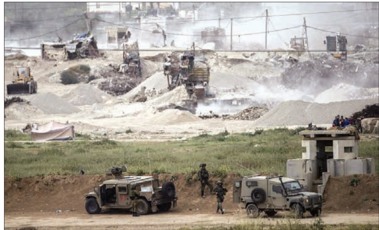
الاحتلال يحشد جنوده واليات على حدود غزة أمس تحسباً لمظاهرات «يوم الأرض»

المستشفيات والمراكز الصحية والنقاط الطبية في محافظات قطاع غزة تحسباً لاعتداءات إسرائيلية على المتظاهرين في «يوم الأرض».