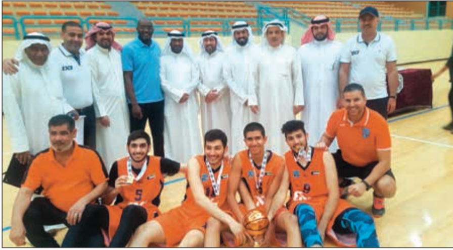
مسؤولو الاتحاد إلى جانب ناشئي كاظمة أبطال البطولة