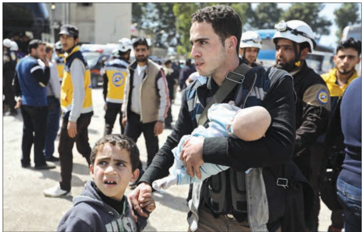
مهاجرون سوريون من الغوطة لدى وصولهم إلى قلعة المضيقي أمس

عواصم - وكالات: أفادت مصادر في المعارضة السورية، بأن الجيشين السوري الحر والتركي سيطرا على مدينة تل رفعت في شمال روسيا أمس. ونقلت شبكة «شام» الإخبارية عن مصادر وصفتها بالمطلعة، تأكيدها انسحاب القوات الروسية وعناصر وحدات حماية الشعب الكردية التي تهيمن على قوات سوريا الديمقراطية «قسد»، من عدة مناطق شمال حلب، وذلك بعد اتفاق تركي - روسي. وبحسب المصادر فإن القوات التركية وقوات الجيش السوري الحر تقدمت في المنطقة ودخلت مدينة تل رفعت وعين دفة ومطار منغ وقامت بتمشيط المنطقة، بعد انسحاب الجيش الروسي «قسد». وحذرت المصادر المدنيين من الاقتراب من المناطق والمدن والقرى المحررة، نظرا للقيام قسد بتمشيط غالبية المنازل وزرع الغلام وحبوات ناسفة في الطرقات والشوارع، حيث يجري