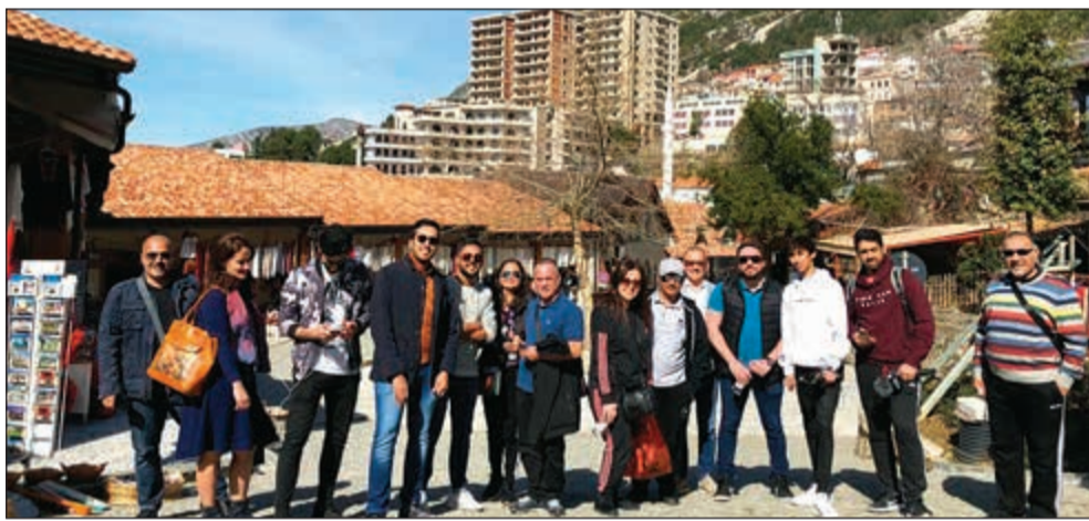
الوفد الزائر في لحظة تذكارية

إذا كنت من عشاق الوجهات الأثرية والأجواء الرومانسية، فننصح بحجز ليلة في فنادق بيرات الجميلة، هذه المدينة الهاربة من الزمن والتي تشبه إلى حد كبير العاصمة الجورجية تيليسي، تبعد قرابة 103 كم جنوب العاصمة تيرانا، وهي إحدى أقدم المدن المأهولة بالسكان في العالم، حيث تعود بعض الآثار فيها إلى القرن الرابع قبل الميلاد، وقد تم وضع الأحياء القديمة فيها على لائحة اليونسكو للتراث العالمي.