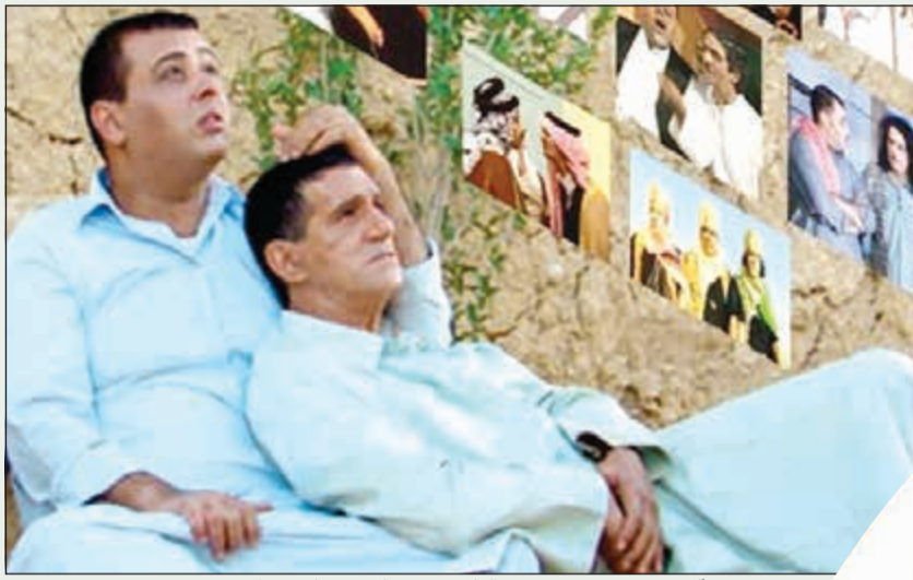
صورة آخر عمل جمع درويش والبلاد في مسلسل «حارث وارش»