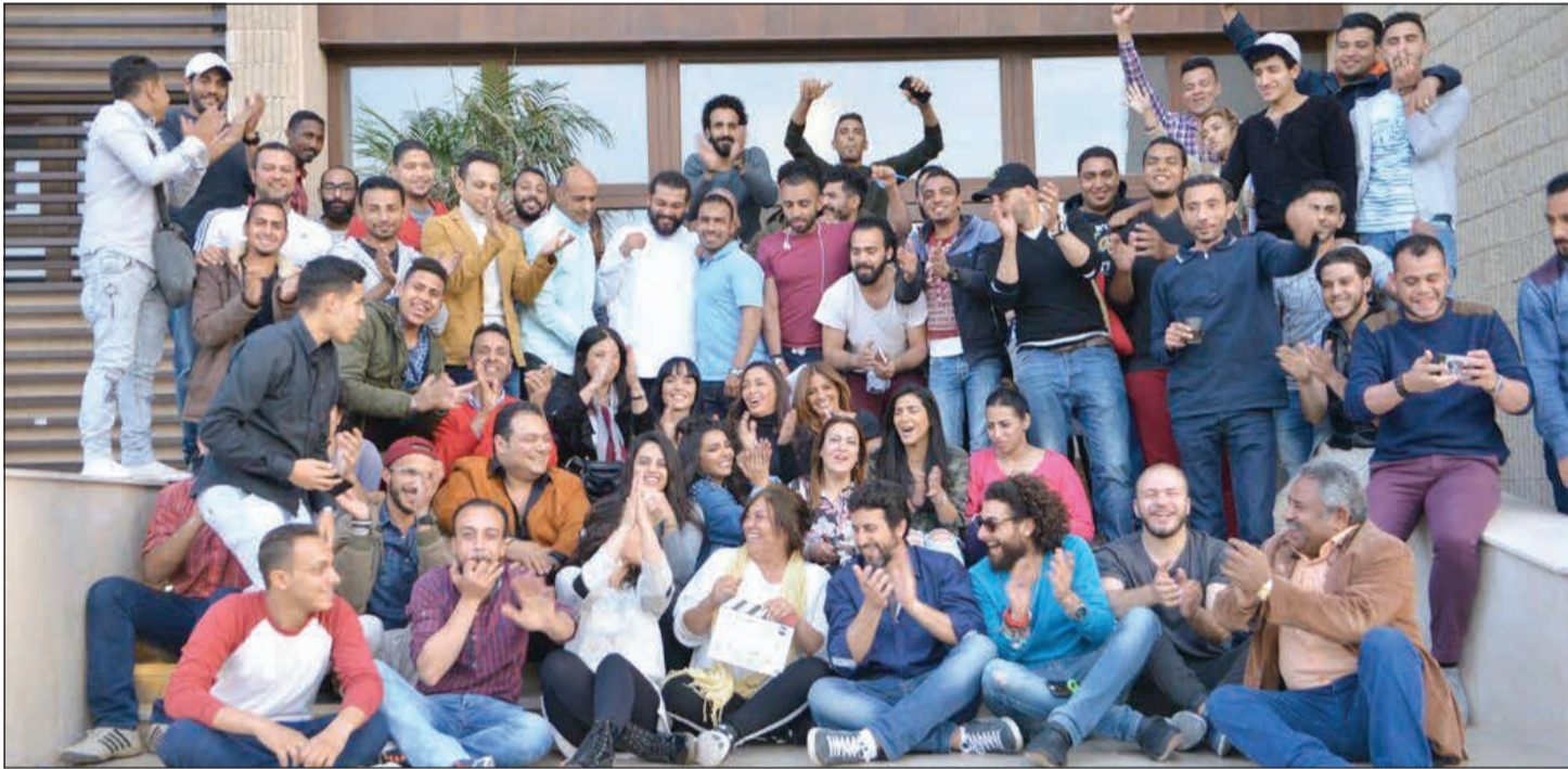
فريق المسلسل في لحظة جماعية