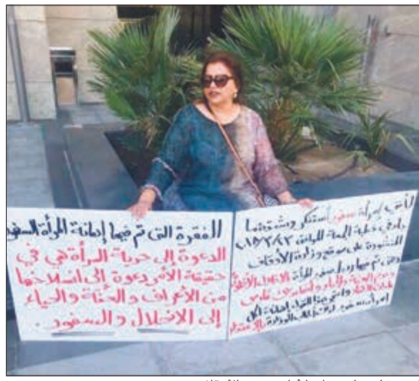
السيدة لدى اعتصامها أمام مبنى «الأوقاف»

المبنية على نفي وجود الله جل جلاله وتصرفه في الكون ونفي أصل الخليقة. وتابع قائلاً: «وثاناً: من أخطر ما يكون أن نبني الأحكام على اجتزاء الكلام من سياقه دون النظر إلى الكلام الذي جاء قبله وبعده، كمن يأتي بكلام الله جل جلاله: (ويل للمصلين) ولا يكمل الآية (الذين هم عن صلاتهم ساهون). وأوضح أن الحديث في الخطبة عن أهل الالحد المعاصر وما يدعون إليه من الكفر والالحد من جميع القبود الشرعية والأخلاقية، والتحذير من الانسلاخ من الاعراف والعفة والحياة إلى