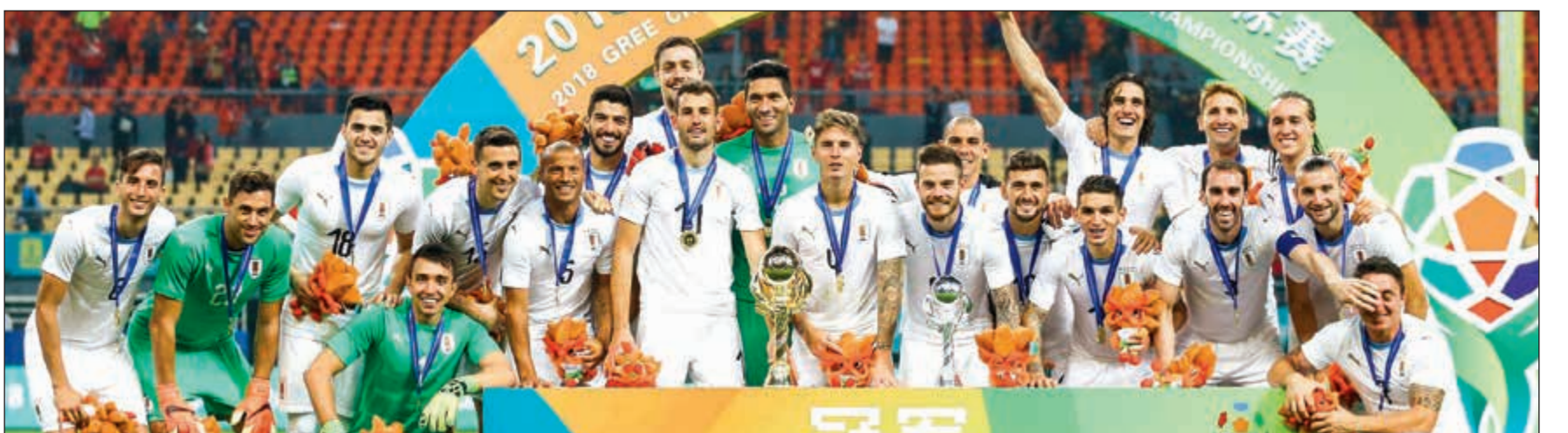
فرحة لاعبي منتخب أوروغواي بلقب بطولة الصين الدولية الودية