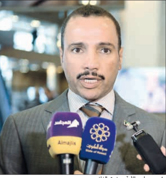
رئيس مجلس الأمة مرزوق الغانم

تقدما به، فهناك في نهاية الأمر بند وحيد يقر كبنود طارئ في نهاية الدورة». وقال «نحمد الله سبحانه وتعالى أولا وآخرنا ونهني صاحب السمو أمير البلاد حفظه الله ورعاه والشعب الكويتي على نجاح وفد البرلمان الكويتي في تحقيق مبتغاه ونصرة قضايا الأمة». واختتم الغانم تصريحه قائلا «كما لا يفوتني ان اتقدم بالشكر الجزيل لأختي وإخواني أعضاء الشعبة البرلمانية الذين كانوا خير معين، والأبطال موظفي الأمانة العامة لمجلس الأمة الذين نعرف نحن عن قرب ما قاموا به من جهد وواصلوا الليل بالنهار من أجل التحضير لمثل هذه الدورات التي تكللت بالنجاح».