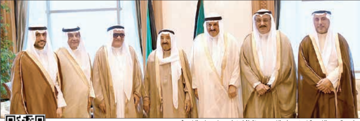
صاحب السمو الامير الشيخ صباح الاحمد مستقبلا اعضاء مبرة معرفي الخيرية