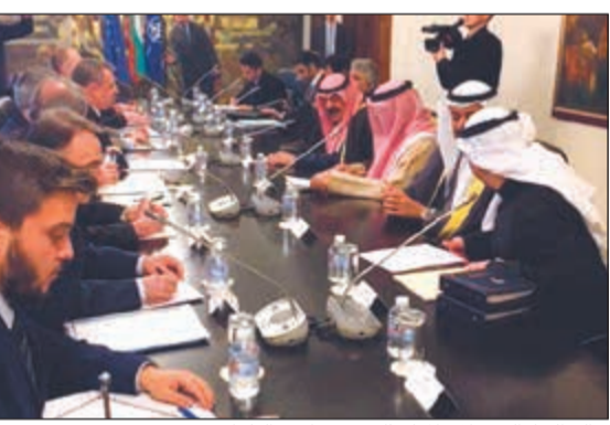
خالد الجار الله خلال المباحثات مع نظيره البلغاري

ببينها الاقتصاد والاستثمار والطاقة والتعاون الصحي والتعلمي وغيرها من المجالات. كما لفت إلى وجود 22 اتفاقية توطر العلاقات الثنائية بين البلدين فيما من المنتظر توقيع 12 اتفاقية أخرى في أثناء الزيارة المرتقبة لرئيس وزراء بلغاريا إلى الكويت في منتصف أبريل المقبل. وقال نائب وزير الخارجية «اننا ننظر بتفاؤل إلى تطویر حجم العلاقات بين الكويت وبلغاريا وستكون بيننا لقاءات مشتركة لتحضير زيارة رئيس الوزراء البلغاري إلى الكويت». وأشار إلى اللقاء الذي تناول القضايا الإقليمية والدولية محل الاهتمام المشترك مؤكدا تطابق وجهة نظر البلدين بشأن هذه القضايا. وقبما يتعلق بقضايا المنطقة قال الجار الله انه لمس «كل الدعم والتأييد من قبل بلغاريا ومن خلالها دعم