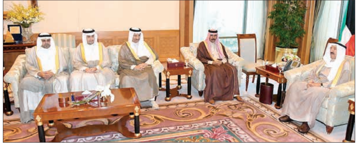
صاحب السمو الامير الشيخ صباح الاحمد مستقبلا بحضور سمو ولي العهد الشيخ نواف الاحمد سمو الشيخ جابر المبارك وأنس الصالح ومحمد الجبري