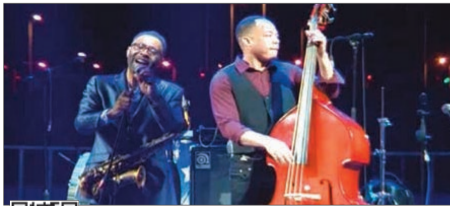
كينني جاريت و آل دي ميولا ابهرا الجمهور السعودي

قدم موسيقيون عالميون معزوفات في مهرجان موسيقى الجاز العالمي في مدينة جدة السعودية، في ثاني حفل للمجاز ينظم بالملكة خلال شهر. وأبهر عازف الساكسفون كيني جاريت الحائز جائزة جرامي وعازف الجيتر آل دي ميولا الجمهور الذي احتشد في مدينة الملك عبدالله الاقتصادية التي استضافت المهرجان. وقالت سعودية من جمهور الحفل تدعي وفاء با وزير «الجمهور ذوق (ذواق) مستمتع جيد للموسيقى. فأكيد يحتاج لهذا النوع من الفعاليات، هذه الأنواع من المهرجانات الموسيقية.