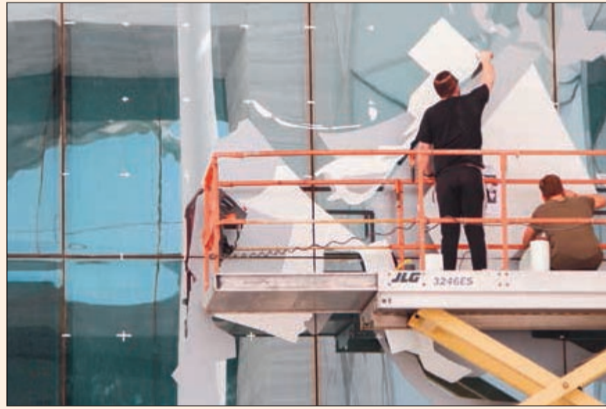
جانب من عملية تركيب الأشرطة الملونة

عبدالله السالم الثقافي يهدف تقديم معارض عالمية وبرامج تعليمية عامة لتوعية شعب الكويت إضافة إلى تسهيل تبادل المعرفة وتطوير مهارات التفكير النقدي والإبداعية والتعريفية.