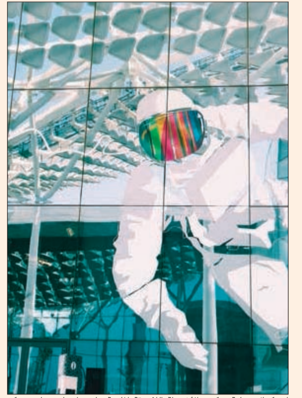
استكمال عملية تركيب الأشرطة اللاصقة الملونة على واجهات مباني مركز الشيخ عبدالله السالم الثقافي

وذكر أن المجموعتين وعدتا ورش عمل هدفن إلى تعزيز