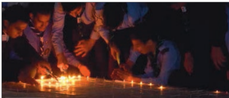
الأردن يحيي ساعة الأرض برقم قياسي عالمي لأكبر لوحة فسيفسائية من الشموع