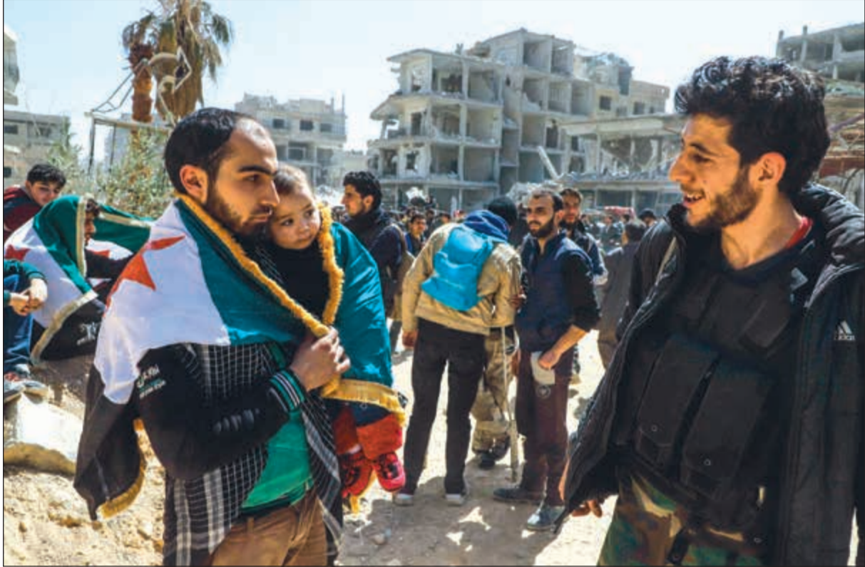
مهجرون من اهالي عفرين ينتظرون دورهم للخروج