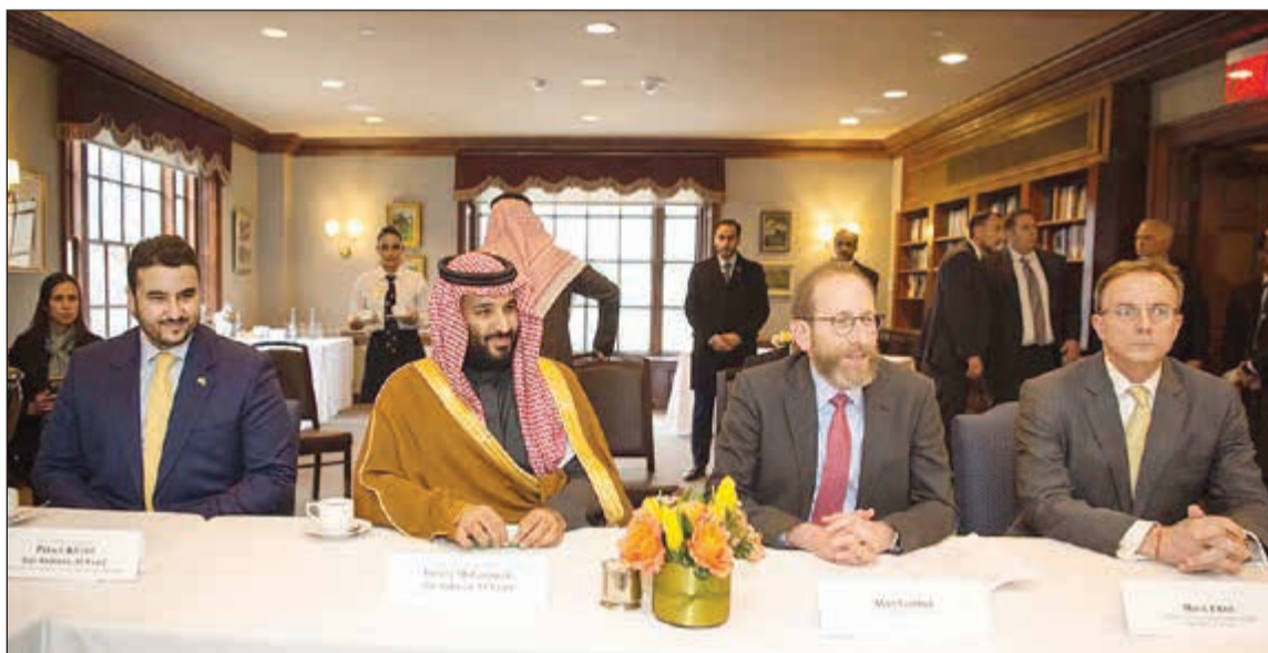
صاحب السمو الملكي الأمير محمد بن سلمان في جامعة هارفارد

فيه نماذج من الابتكارات الصناعية الحديثة لعدد من الجامعات والشركات السعودية، ومجموعة مختارة من منتجاتها التقنية. وشهد الأمير محمد بن سلمان توقيع 4 اتفاقيات