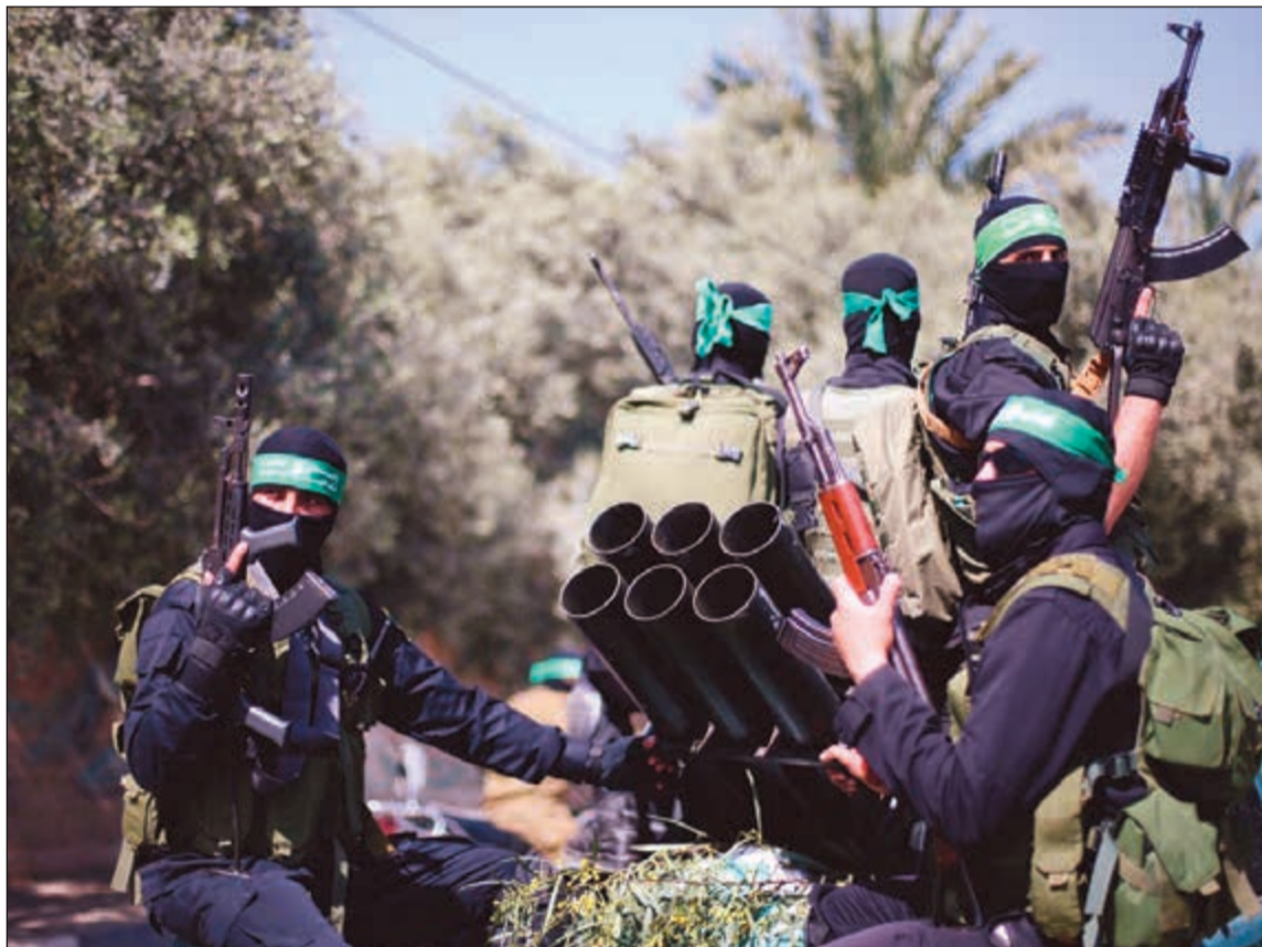
عناصر من كتائب القسام خلال المناورات في غزة امس (رويترز)

عواصم - وكالات: أجرت كتائب عز الدين القسام، الجناح العسكري لحركة حماس، امس، مناورات عسكرية في قطاع غزة بمشاركة نحو 30 ألفا من مقاتليها، وأطلقت خلالها صواريخ تجاه البحر.