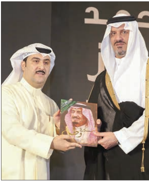
العيمري يهدي كتاب خادم الحرمين للأمير سلطان بن خالد الفيصل

ظواهر اجتماعية قبيحة تحتاج منا إلى تنبيه ونصيحة واستماع وبدء!