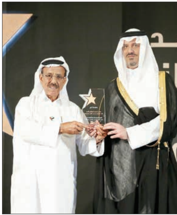
الجبثور مع الأمير سلطان بن خالد الفيصل يتسلم جائزة والده