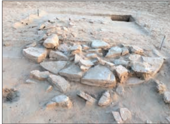
المحلة الأثرية المكتشفة تعود إلى 2500 عام قبل الميلاد