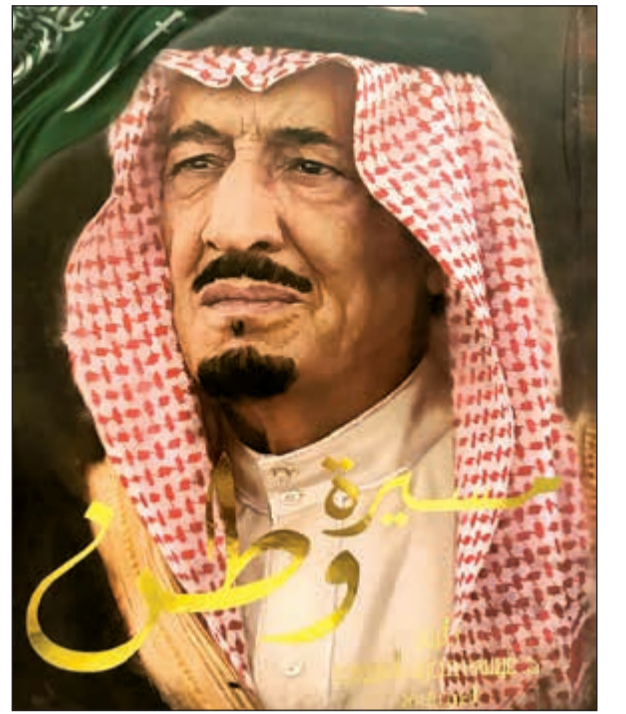
غلاف الكتاب المهدى إلى الأمير سلطان بن خالد عن خادم الحرمين