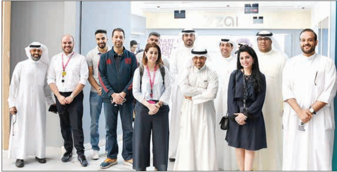
مسؤولو زين خلال افتتاح الفرع الجديد

الحاجة لزيارة الأفرع، هذا بالإضافة لخدمات إعادة تعبئة الرصيد، ودفع الفواتير، وإدارة الحساب، وشراء الأجهزة من خلال فرع زين الإلكتروني، وغيرها. وبينت زين أن الفرع الجديد يحتوي أيضاً على ركن خاص لحلول وخدمات علامة Zain Life المبتكرة في مجالات أمن المنازل والترفيه الرقمي، والتي أحدثت حلول أمن المنزل الذكي التي تشمل كاميرا مراقبة ذكية، ومستشعر الحركة، ومستشعر حركة الباب النافذة، وكاشف الدخان الذكي، هذا بالإضافة لخدمات الترفيه الرقمي من خلال جهاز PlayStation VR للألعاب الإلكترونية بتقنية الواقع الافتراضي. وأضافت زين أن فرعها الجديد (وهو الفرع الثالث لزين في مجمع الأقنيوز) يقدم مفهوماً استثنائياً متجدداً لنوعية الخدمات التي تطرحها الشركة، وذلك من خلال توافر أحدث أنواع الأجهزة الذكية وخدمات الاتصالات وشاشات