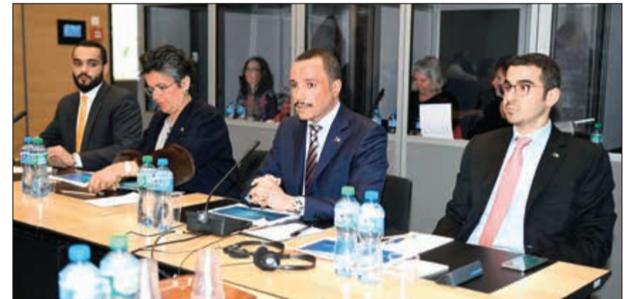
الرئيس مرزوق الغانم وصفاء الهاشم وأعضاء من الوفد خلال جلسة استماع للجنة حقوق الإنسان للبرلمانيين في الاتحاد البرلماني الدولي على هامش دورته الـ 138

«سيتي باص» تسعى دائما لتقديم الأفضل للكويت 26