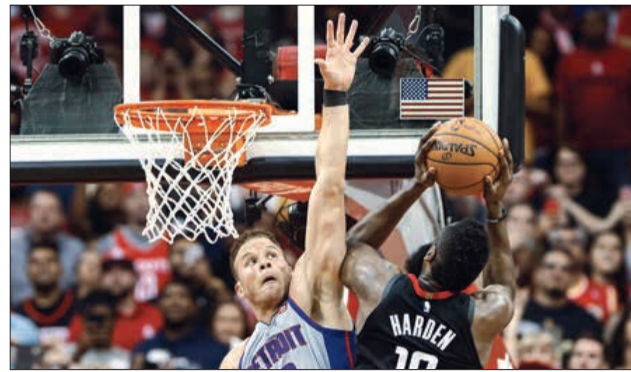
فوز هيوستن روكتس ساهم في تأهل كليفاند

تأهل كليفاند كالفاليرز، وصيف البطل، إلى الأدوار النهائية (بلاي أوف) من الدوري الأميركي في كرة السلة للمحترفين للمرة الرابعة توالياً من دون أن يلعب مستفيداً من فوز هيوستن روكتس متصدر المنطقة الغربية على ضيفه ديترويت بيستونز من الشرقية 100-96 بعد التمديد.