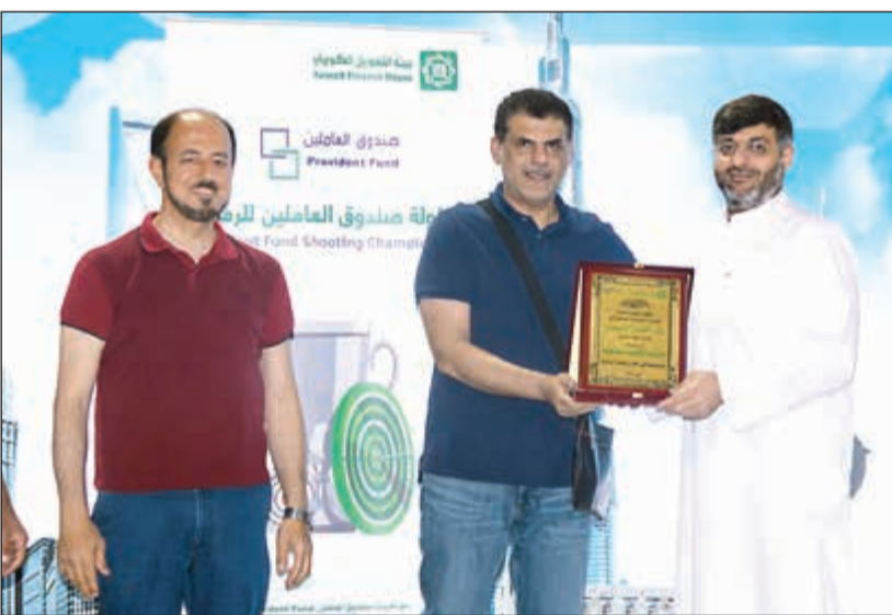
تكريم أحد المشاركين

نظم بيت التمويل الكويتي «بيتك» من خلال صندوق العاملين «بطولة الرماية» شارك فيها عدد كبير من الموظفين بصالات نادي الرماية ووسط أجواء تنافسية أخوية، حيث تبارى الموظفون المشاركون في التصويب على الأهداف، وتم تكريم المفازين في نهاية المسابقة بحضور أعضاء مجلس إدارة صندوق العاملين. وقد عكست المشاركة الكبيرة من الموظفين عمق التفاعل والاهتمام بالبطولة