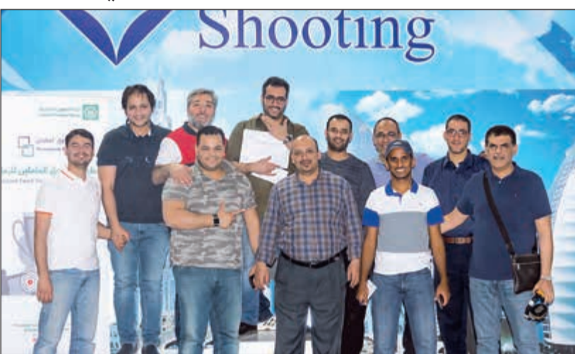
جانب من منافسات البطولة

والرياضة، حيث أحرز العديد من الموظفين مراكز متقدمة جدا وحققوا أرقاما مهمة، واستحق الأوائل منهم جوائز قيمة خصصت للمفازين في مستويات اللعبة المختلفة. ويؤكد «بيتك» اهتمامه بالمساهمة في الأنشطة الشبابية والرياضية، ضمن برنامج المسؤولية الاجتماعية والتواصل مع شرائح المجتمع المختلفة، مع التأكيد على أهمية الموظف ودوره الحيوي وضرورة رعاية ودعم ممارسة الموظفين لهواياتهم خاصة النشاط الرياضي في مختلف اللعاب.