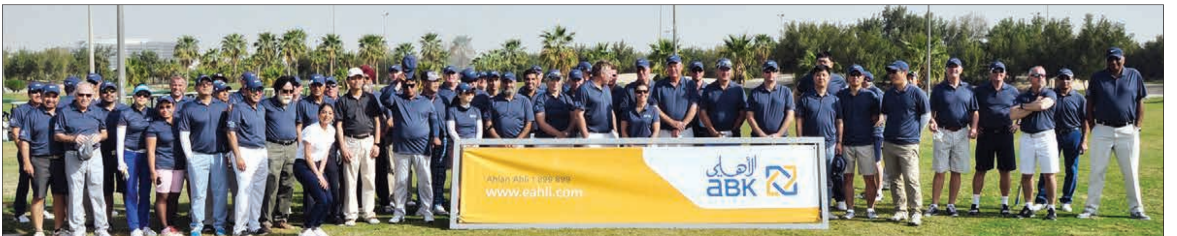
لقطة جماعية للمشاركين في البطولة

اختتم البنك الأهلي الكويتي بطولته السنوية السابعة للغولف، التي تهدف إلى التثاقف العملاء مع شركاء الأعمال في جو تنافسي رياضي مشترك. وقد أقيمت فعاليات البطولة في منتجع صحاري للغولف في 10 مارس الجاري، حيث شارك فيها 80 لاعبا. وقد تم تقسيم المشاركين في هذه البطولة إلى عدة فرق، كل فريق مكون من 4 لاعبين، وأقيمت المسابقة وسط أجواء من المنافسة الممتعة للفوز بدرع البنك الأهلي الكويتي للغولف. وفاز بالمركز الأول الفريق المكون