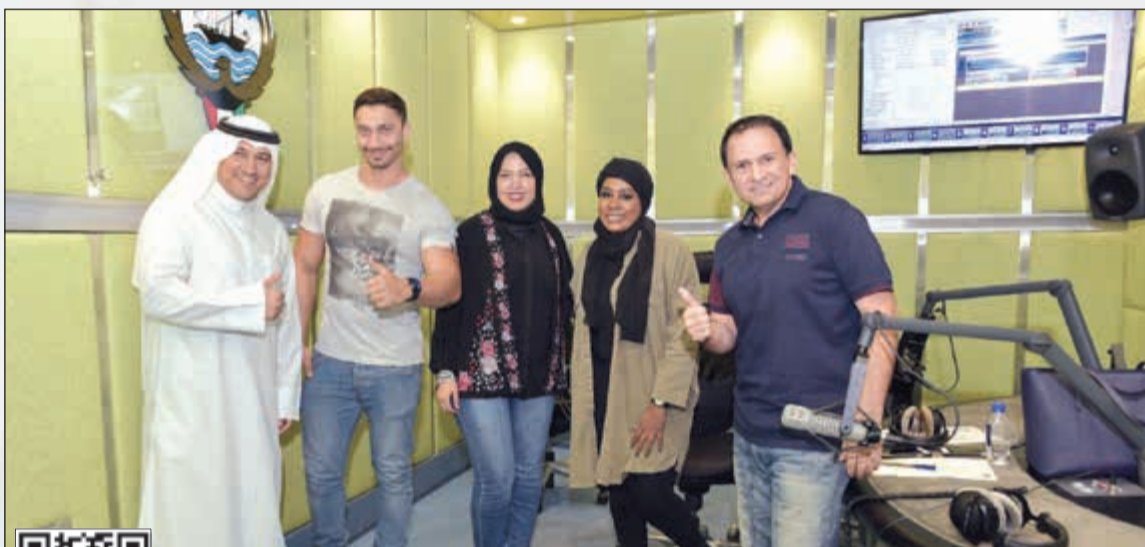
لقطة جماعية لفريق برنامج «لأهلي أحلى هدية»