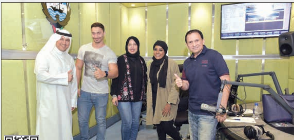
لقطة جماعية لفريق برنامج «أهلي أحلى هدية»