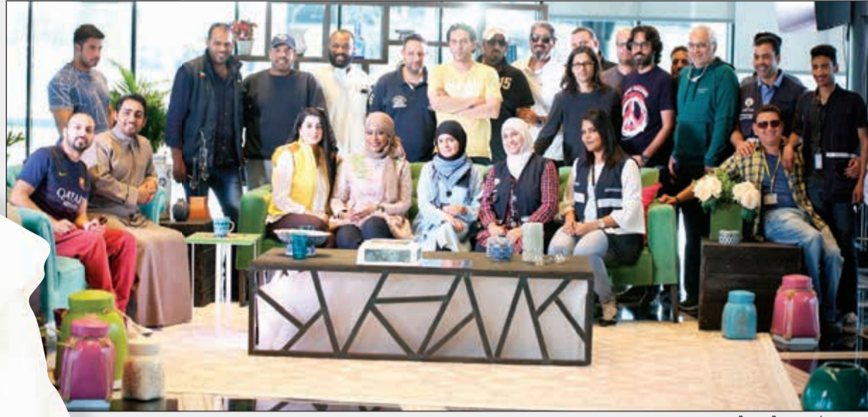
فريق برنامج «يمعة الجمعة»