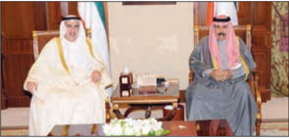
سمو ولي العهد مستقبلا عبدالعزيز الابراهيم