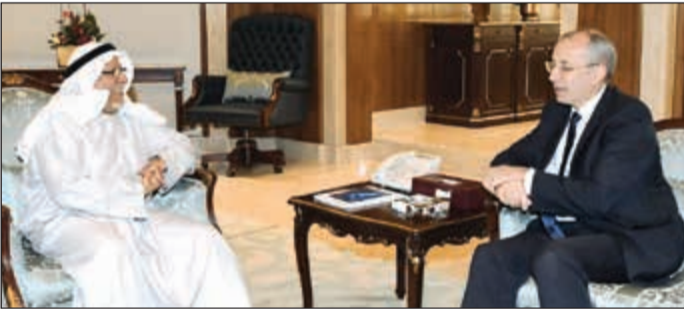
الشيخ علي الجراح مستقبلا السفير مايكل دافنبورت