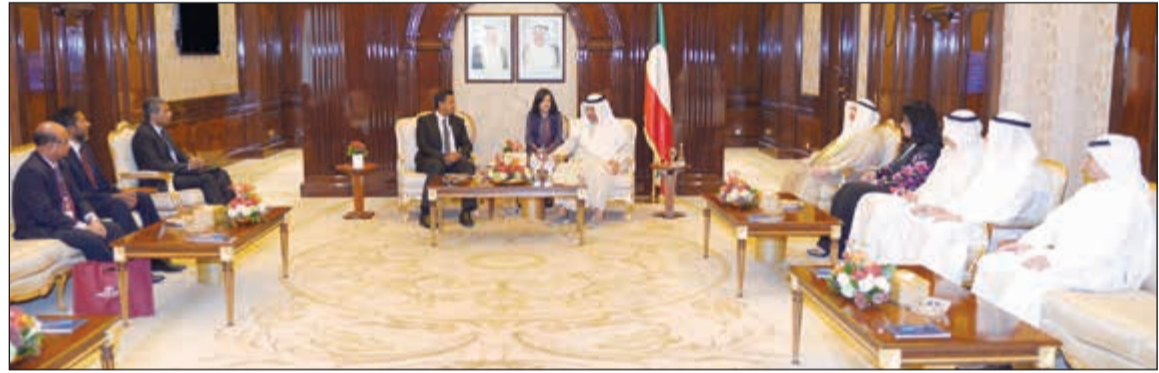
سمو رئيس الوزراء الشيخ جابر المبارك مستقبلا عادل الصرعاوي ومدقق عام المالديف

استقبل سمو رئيس مجلس الوزراء الشيخ جابر المبارك في قصر بيان امس رئيس ديوان المحاسبة بالإتابة عادل الصرعاوي برفقة مدقق عام جمهورية المالديف حسن زيات والوفد المرافق له وذلك بمناسبة زيارته للبلاد. حضر المقابلة رئيس ديوان رئيس مجلس الوزراء الشيخة اعتماد الخالد.