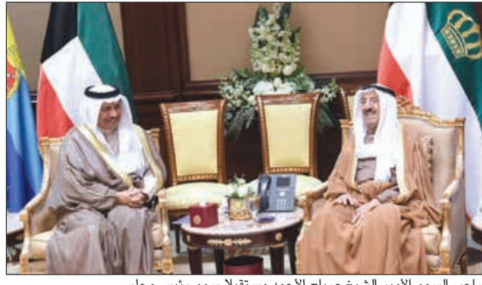
صاحب السمو الأمير الشيخ صباح الأحمد مستقبلا سمو رئيس مجلس الوزراء الشيخ جابر المبارك

تحت رعاية وحضور محافظ الأحمدى الشيخ فواز الخالد، تنظم المحافظة غدا الجمعة «ملتقى الأحمدي الأول للتنمية البشرية»، الذي يستمر على مدى يومين في واحة الأحمدي التابعة لشركة نفط الكويت بمشاركة عدة جهات رسمية وإهلية وتطوعية. ويعقد الملتقى للمرة الأولى تحت مظلة أحد أبرز مسارات المشروع التنموي بعيد المدى الذي أطلقته المحافظة مطلع إبريل 2015 وهو مشروع «محافظةنا أجمل»، والذي يضم العديد من الأششطة والفعاليات، وفي مقدمتها ورش عمل