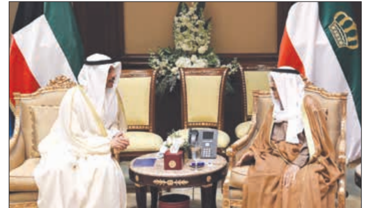
صاحب السمو الأمير الشيخ صباح الأحمد مستقبلا رئيس مجلس الأمة مرزوق الغانم