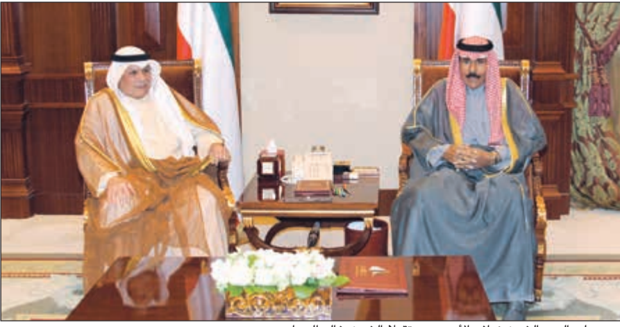
سمو ولي العهد الشيخ نواف الأحمد مستقبلا الشيخ خالد الجراح