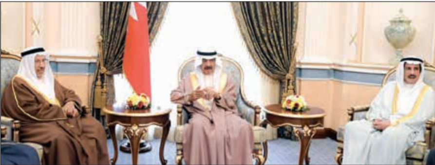
رئيس الوزراء البحريني الأمير خليفة بن سلمان مع السفير الشيخ عزام الصباح

تفقد الخطط التنموية التي تعزز مكانة المملكة ومكتسبات شعبها في الحاضر. وأوضح أن مسيرة البحرين تزر بتاريخ ممتد في عمق الحضارة الإنسانية وماض حافل بالعباءة وغزير بالمآثر التي خلدتها رجالات البحرين بما قدموه من إسهام متميز في مسيرتها الحضارية. وأشار إلى أهمية الأدوار التاريخية للعوائل البحرينية والخليجية العريقة في الحفاظ على ما يجمع بين الشعوب الخليجية من روابط وأواصر الأخوة والمحبة. من جانبه، أكد سفيرنا لدى البحرين الشيخ عزام الصباح المكانة الكبيرة لرئيس الوزراء البحريني محليا وخليجيا وعربيا وما يمثله بحكمته وحنكته ومواقفه المشرفة من قيمة عالية لدى الجميع.