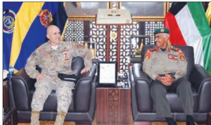
الفريق الركن محمد الخضر مستقبلا العميد طيار سانت كلمنتي