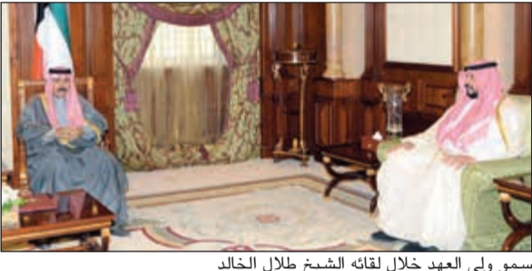
سمو ولي العهد خلال لقائه الشيخ طلال الخالد