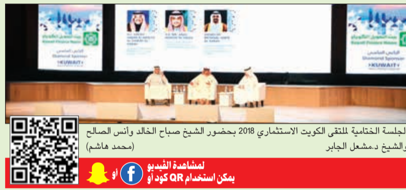
الجلسة الختامية للملتقى الكويت الاستثماري 2018 بحضور الشيخ صباح الخالد وأمس الصالح والشيخ دمشعل الجابر