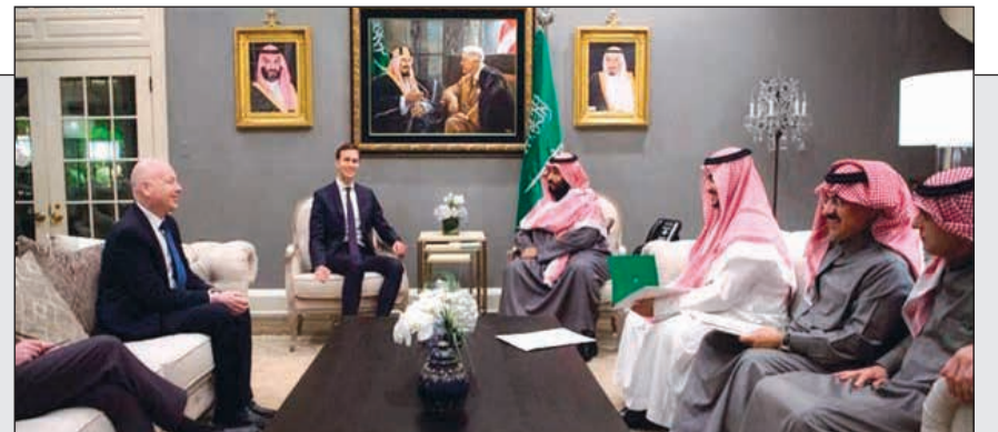
صاحب السمو الملكي الامير محمد بن سلمان ولي العهد السعودي خلال اجتماعه بمستشار الرئيس الأميركي وصهره جاريد كوشنر ومبعوث السلام في الشرق الأوسط جيسون غرينبلات في السفارة السعودية بواشنطن

محمد بن سلمان يبحث في واشنطن عملية السلام والحرب في اليمن 32