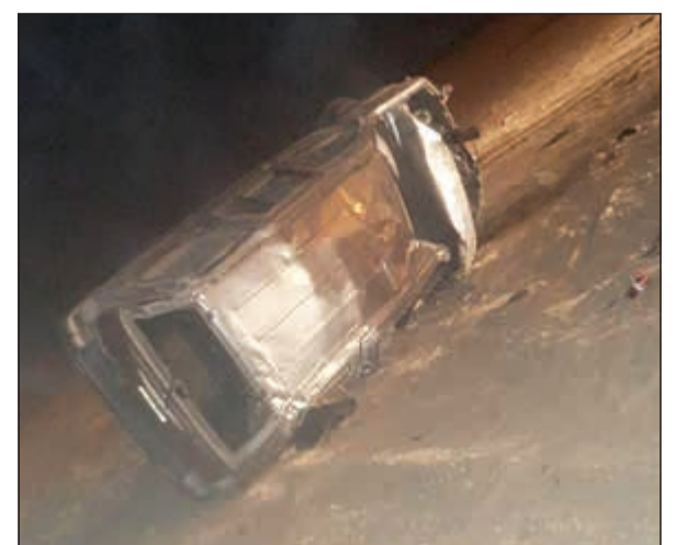
المركبة بعد انقلابها على طريق العبدلي