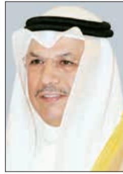
الشيخ خالد الجراح

أصدر نائب رئيس مجلس الوزراء ووزير الداخلية الفريق م. الشيخ خالد الجراح قراراً وزارياً يتم بموجبه إعادة تشكيل مجلس أكاديمية سعد العبدالله للعلوم الأمنية. ونص القرار في مادته الأولى على إعادة تشكيل مجلس أكاديمية سعد العبدالله للعلوم الأمنية برئاسة وزير الداخلية الفريق محمود الدوسري، وعضوية كل