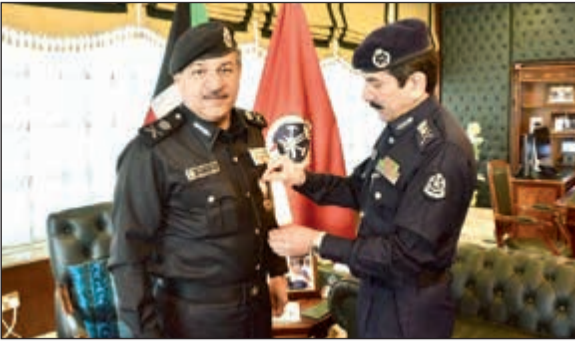
الفريق خالد المكراد يقبل اللواء جمال الصايغ «وسام الفارس الدولي»