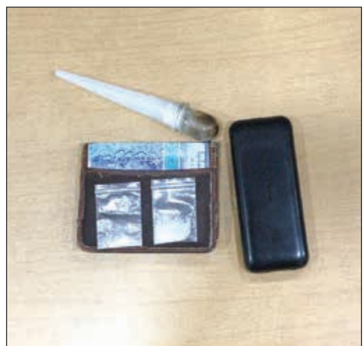
جانبا من المصبوطات

المطلوبين والمخالفين، اشتبه رجال الأمن في مركبة سارت بشكل سريع وعند الطلب من قائدها التوقف لم ينصع لأوامر رجال الأمن فتمت ملاحقته إلى أن تم ضبطه وتبين أنه شخص من غير محدد الجنسية مطلوب بـ 16 ألف دينار، وتمت إحالته لإدارة التنفيذ المدني. تبين أنه خليجي ومرافقه المواطن إثباتاتها، وتبين لمركبة على كيسي شبو وأدوات تعاط. على صعيد متصل، ألقى رجال أمن الجهراء القبض على مواطن خليجي كانا على متن مركبة وبحالة غير طبيعية. وذكر مصدر أمني أن إحدى الدوريات الأمنية وخلال جولة لها في منطقة العيون رصدت مركبة مملوكة بـ 10 سجائر مشتبه في أنها مواد مخدرة، وأحيل إلى جهة الاختصاص.