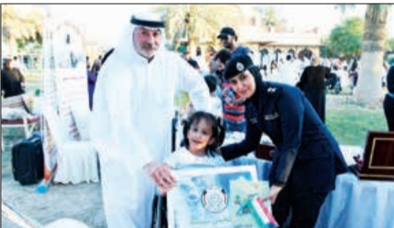
ضابطة من شرطة البيئة تقدم هدية الى طفلة خلال الفعالية