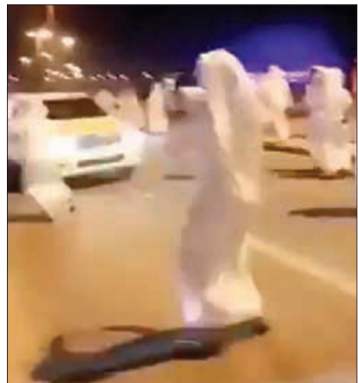
أحد المستهترين يقصف الدورية بحجر

بلغ استهتار في منطقة الصباحية، مشسرا إلى ان جميع من شاركوا في واقعة الاعتداء على الدورية سيتم إحالتهم إلى جهة الاختصاص بتهم تتعلق بمقاومة رجال الأمن وإتلاف مال الدولة. وأكد المصدر الأمني