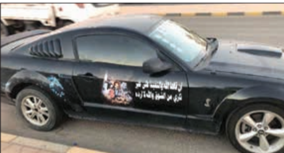
المركبة المخالفة في طريقها إلى كراج الحجز